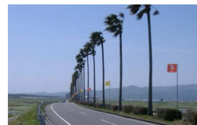
道路中央のワシントンニアパームは、宮崎のシンボリック景観