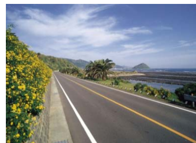
コバノセンナの黄色が空と海の青を一層引き立てる沿道景観

そしてこの美しい風景は宮崎県の風土として根付き、花みどりあふれる美しい景観を愛するという宮崎県民の文化を育てたのである。