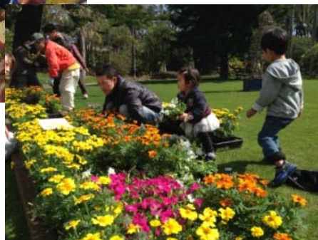
オープニングイベントの会場づくりも市民参加で「みんなでつくりょうフラワーカーペット」