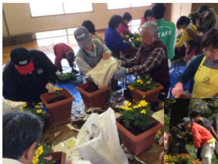
家々の門を飾るプランターづくり「まちかど寄せ植え教室」

日南海岸きらめきラインでは、自治会や学校に活動のチラシを配布し、活動団体だけではなく、地域住民が活動の主役になれるような工夫をしている。