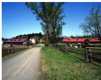
小岩井農場（雫石町）