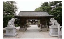
隨身門 (ずいしんもん) のある宇美神社

が眺められます。本石橋家は、明治初期には自宅に学校 (郷校) を開くなど地域に多大な貢献をした家でもあります。