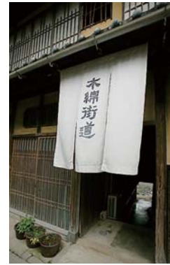
白いシンプルなのれんが町を彩ります。

切妻妻入り塗家造りの「本石橋邸」と「旧石橋酒造 (NIPPONIA出雲平田木綿街道)」などの建物が風情ある景観を醸し出しています。贅を尽くした格式ある書院造りの部屋からは手入れの行き届いた見事な庭