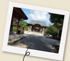
縁切り参詣の神社「宇美神社」