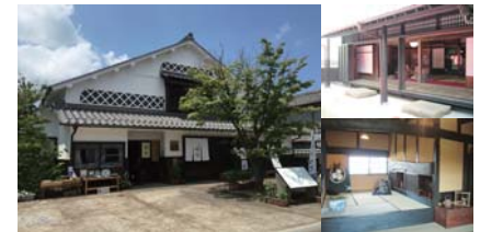
お食事やお土産物、町なみのご案内は「木綿街道交流館」へどうぞ

「イザナギとイザナミ」が祀られており、お詣りすると良縁を授かると言われています。新たな縁を願う前にまず本社拝殿にて縁切りの祈願をし、時計回りに本殿を回り、縁結神社にお詣りしていただくことで、過去のものへの執着を絶ち切り、良縁を授かることができると言われています。