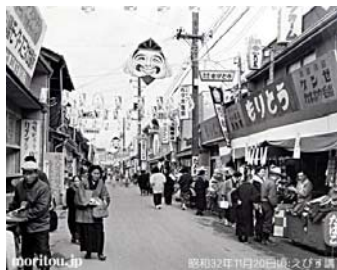
昭和 32 年の様子