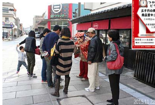
平成 27 年の様子