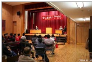
安仁屋 宗八 OB 会長によるトークショー

また、25年ぶりにセ・リーグで優勝した広島東洋カープを祝し、OBの安仁屋 宗八会長によるトークショーを開催し、会場を沸かせました。