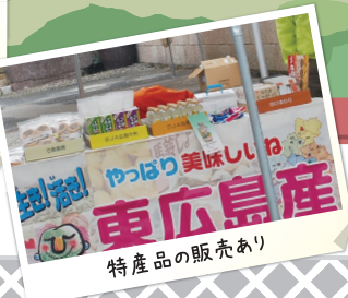
特産品の販売あり