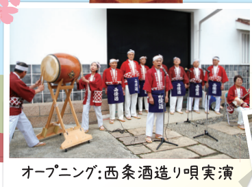
オープニング:西条酒造り唄実演

観光マスコットののん太の人形劇上演をはじめ、わなげゲームコーナーなどのん太と遊ぼう。