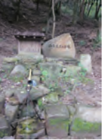
西条龍王の名水 水源の山となっている龍王山八合目の湧水です。