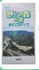
管理事務所 「憩いの森公園みどころマップ」を入手しよう。

開園時間 9:00~17:00 水曜休園。 開館時以外はゲートが閉まっており、車両進入禁止になっている。歩くだけなら休園日も入ることができる。