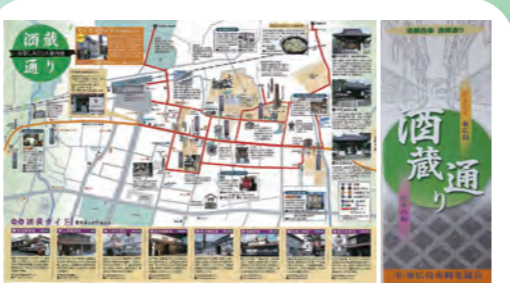
酒蔵通りパンフレット 西条駅周辺の蔵元8社を巡るモデルコースを紹介している。