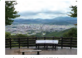
西条の街並みが見渡せる展望台。