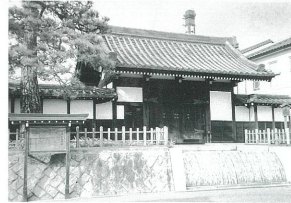
四日市御茶屋御門

御茶屋(本陣)跡 大名の宿泊所で藩営であった。明治になって賀茂郡役所、後、地方事務所などが置かれた。現在は賀茂鶴酒造(株)本社となっている。