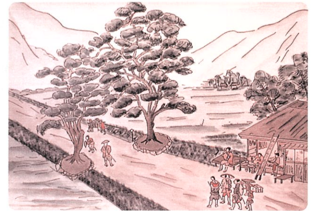
八本松長尾一里塚の風景