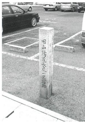
長尾一里塚跡石柱

長尾一里塚跡 江戸時代に一里塚のあった所。飯田村側男松、宗吉村側女松、どちらも4本の枝を出し、街道の上で女松の上に男松がもたれ、陰陽和合の妙を現わし、八本松の名が起きた。