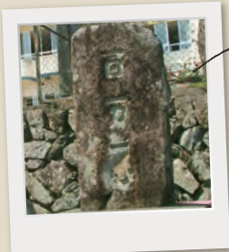
錦帯橋の端材や間伐材で作った案内標識