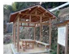
休憩もできる志谷駕籠立場

ここまでは萩藩、杉ヶ峠からは岩国藩の領地です。峠付近には番所があったと伝えられています。本郷から横田までは半日の行程です。