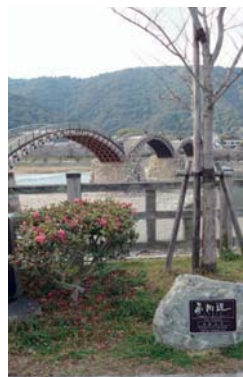
錦帯橋のもとに設置された夢街道のプレート