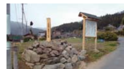
岩国往来まちづくり協議会と地域の人々、ボランティアが立てた「郷一里塚」の説明板