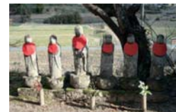
雲照寺の赤いよだれかけをした六地藏

下ると、室町時代創建の雲照寺があります。寺の裏山には不動山が88ヶ所、斜面には石仏群が安置されています。