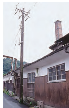
各所に残る現役の木製電柱

倉吉の周辺には、伯耆国の中心として国庁や国分寺が置かれ、万葉の歌人山上憶良も訪れたと言われています。室町時代前半からは城下町、その後は商人の町として栄え、大阪の淀屋橋にその名が残る淀屋につながり、倉吉 いなこきせんぼ や稲扱干刃の販路を全国に広げた「旧牧田家」など江戸時代の豪商