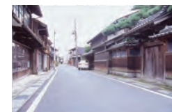
旧小川酒造のある 古い町並み