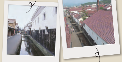
山陰地方の風土の一つである赤瓦が連なり、白壁土蔵とのコントラストが美しい、伝統が息づく街並み。