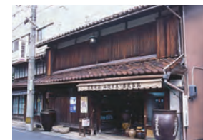
大正時代からの骨董屋

古い民家を改造して、食事処や喫茶店、ギャラリー、雑貨店、工房などつい長居をしまいそうな店もいくつもあって、倉吉は何度訪れても新しい楽しみを発見できるまちです。