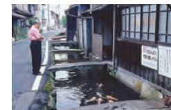
色とりどりの鯉が泳ぐ 鉢屋川