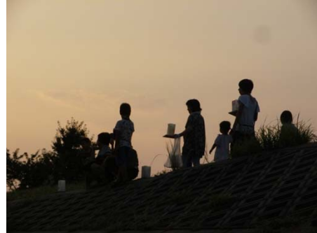
灯ろうを手に集まる人々