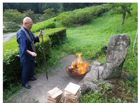
● お焚き上げ (8月29日)