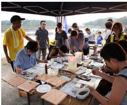
石州和紙で灯ろうづくり