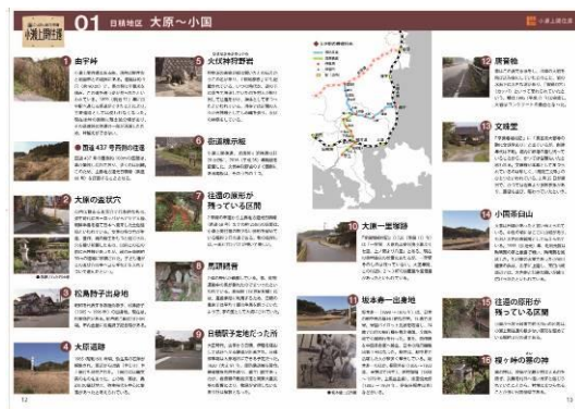
ガイド本の中身（サンプル）