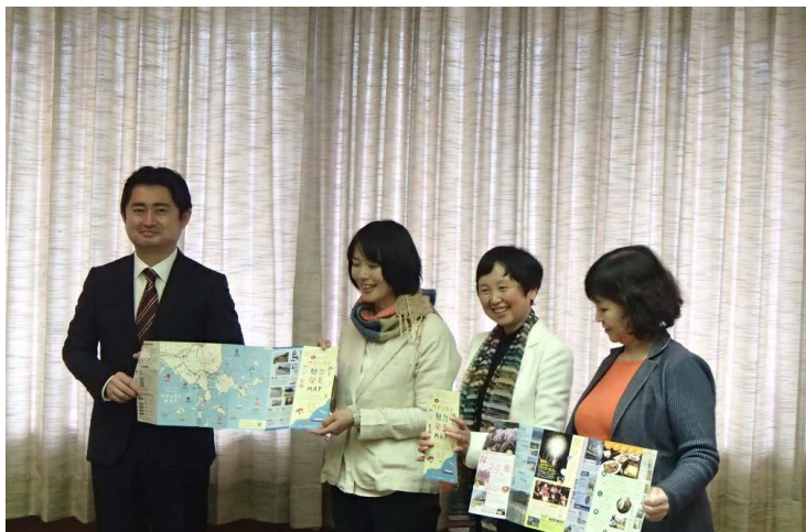
写真：「サザンセット魅力発見MAP」を令和2年3月26日に柳井市長に贈呈

○ 2019年4月より協議を重ねて作成した「サザンセット魅力発見MAP」を観光客誘致に活用していただくためエリア内の市町に寄贈