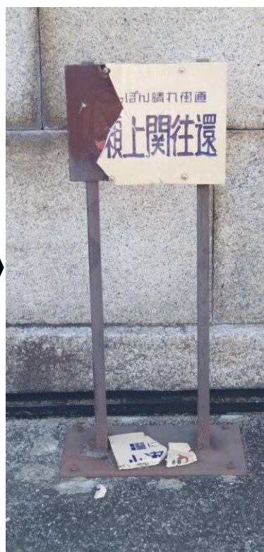
損傷発見時の陶板