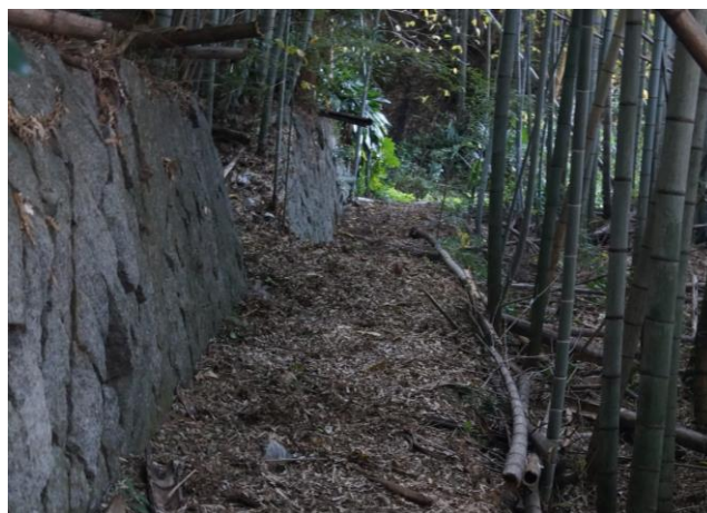
整備後の往還（果子乃季南側）