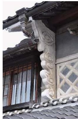
袖壁は「火返し」とも言われ、火除けの願いを込め水と呼ぶ雲形紋があらわれています。

かつての宿場町の中心であった大原古町地区には、風格ある御殿や御成門を備えた本陣、重厚な長屋門が目を引く脇本陣がともに約200年前の姿をとどめています。両方が現存するのは、西国街道の矢掛宿と並び、全国的にも希少な歴史遺産です。両側に水路が流れる街道に沿って、江戸時代後期から明治・大正期に造