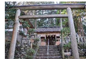
武蔵を慕う人や合格祈願などの人が訪れる武蔵神社

進めると、かつては宮本村と呼ばれた一帯は、武蔵の生家、二刀流のヒントを得たと伝えられる讃甘神社、武蔵の姉の嫁ぎ先とされる平尾家、武蔵資料館などが点在する武蔵ゆかりの里です。絵本をモチーフにした「あばれたけぞう」のプレートをたどりつつ、武蔵の生い立ちに思いをはせながら巡るのも楽しいでしょう。