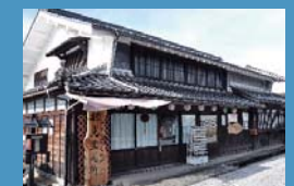
観光案内所(本田邸) 裏手の蔵は改修して民俗資料館となっています。