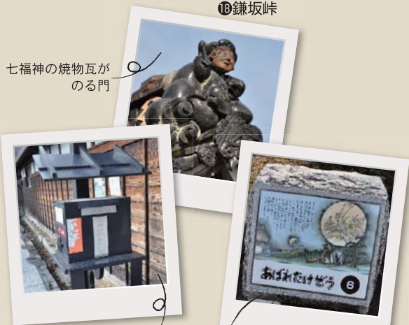
古町では郵便ポストもレトロ調

交通 ● 大原ICから車で約5分 智頭急行大原駅から0.5km お問い合わせ ● 武蔵の里大原観光協会 ☎0868-78-3111