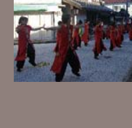
地元の子がうらじゃ踊りで古町を踊り歩きます。