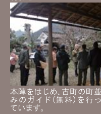
本陣をはじめ、古町の町並みのガイド(無料)を行っています。