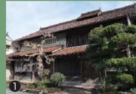
① 築100年の古民家がリノベーションされた店舗、宿です。