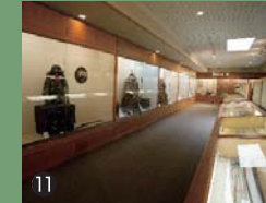
⑪ 武蔵ゆかりの書画・刀剣・鎧などが展示されています。