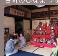
町を散策しながらひなめぐりが楽しめます。