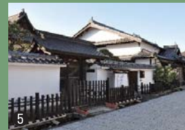
⑤ 数寄屋造りの御殿と御成門が約200年前の姿をとどめています。