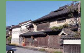
③ 袖壁・虫籠窓、煙出しなどを備え、大原宿を代表する町家様式の建物です。