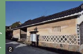
② 重厚な長屋門を備え、平常は第一級の旅館として営業していました。