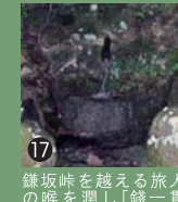
⑰ 鎌坂峠を越える旅人の喉を潤し「銭一貫の値打ちがある」と言われました。

ガイドさんと歩きませんか? お問合せ / みまさか市観光ボランティアガイドの会 TEL : 0868-72-4966