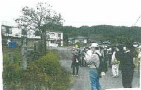
(神宿の石碑群の前で)