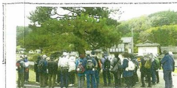
(土居宿 街外れの一里塚跡)