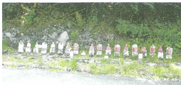
↑ 【根雨宿 東入口の地蔵尊群】