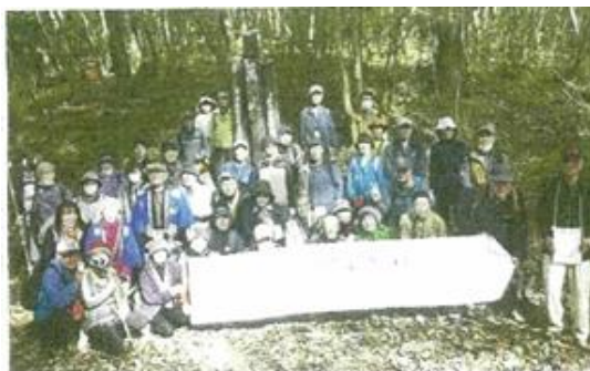
(万龍山 頂上にて記念撮影をする)