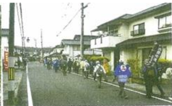
(土居宿の町並みに行く)