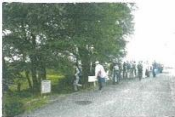
(笠懸の森の説明を聴く)