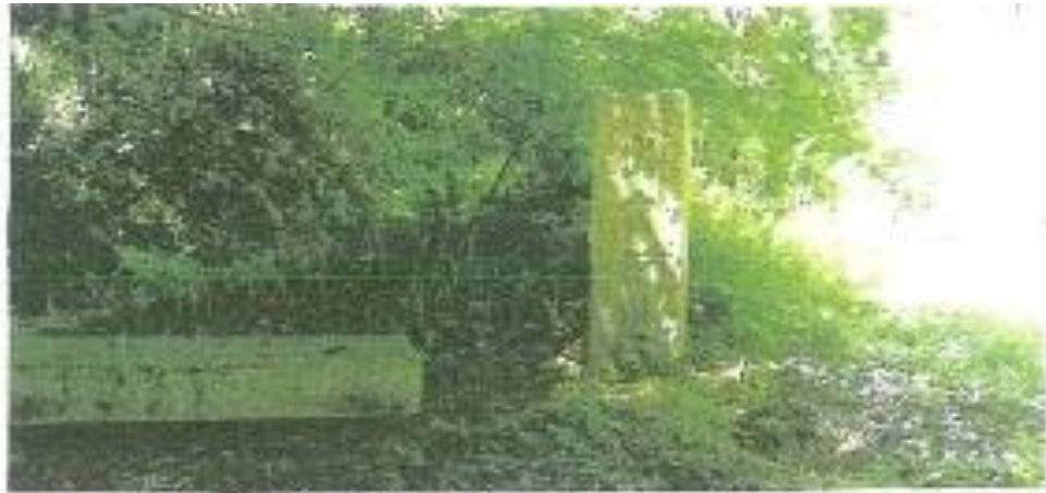
【間地峠 頂上下の山道入口】