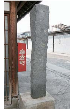
子ども汗疹に効く塩湯温泉「錦海湯」の碑

外堀だった旧加茂川は、人工の運河として使われていました。川に面して建ち並ぶ建物、蔵では、米や鉄などさまざまな物資が積みおろしされ、大いに賑わいました。京橋のたもとに残る廻船問屋「後藤家」(国指