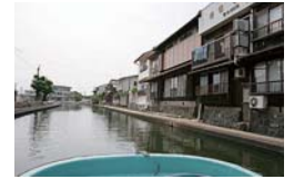
舟から見える旧加茂川沿いの町並み