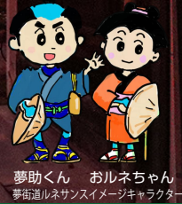
夢助くん おルネちゃん 夢街道ルネサンスイメージキャラクター