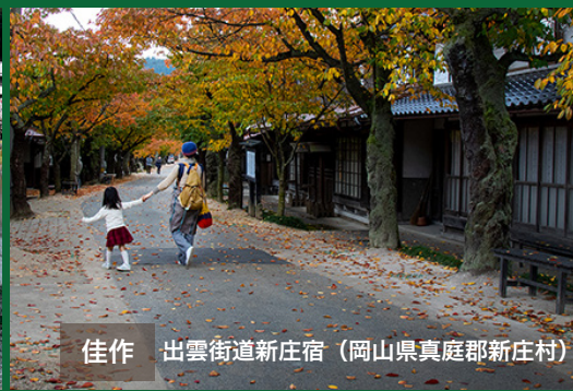
佳作 出雲街道新庄宿（岡山県真庭郡新庄村）