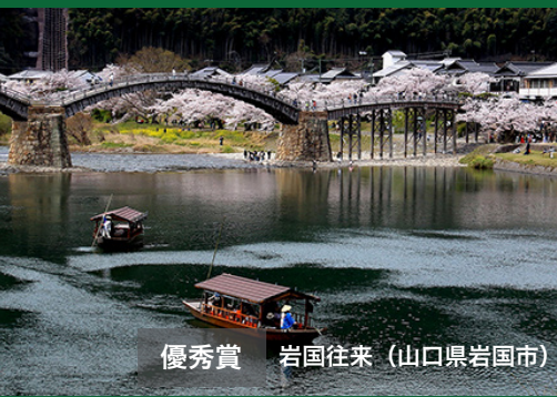
優秀賞 岩国往来（山口県岩国市）