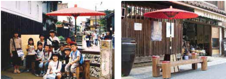
写真 打吹地区歩行ネットワーク整備状況

倉吉打吹地区は、行政と市民が協働で行っている「遥かなまち倉吉」の取り組み・活動等が評価され、まち交大賞「プロセス賞」を受賞！