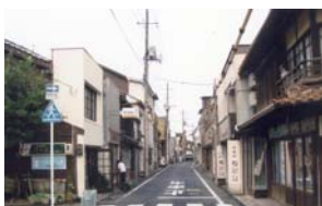
写真 アーケードの撤去

アーケードがある地区は、伝統的建造物が数多くあるが、以前は、歴史的景観を活かしたまちづくりについて関心が薄く、アーケードの撤去が行なわれていなかった。その後、伝統的建造物群保存地区において保存修理事業により、来訪者の増加がみられるなどから、歴史的景観を活かしたまちづくりを目指して、アーケードの撤去を実施した。