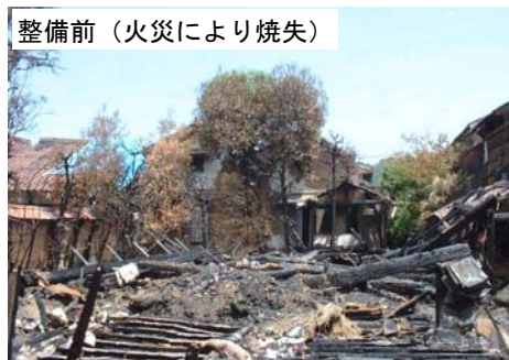
整備前（火災により焼失）