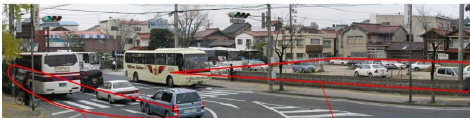
観光バスが道路をふさぎ、交通渋滞が発生

周辺温泉地から来訪者を誘導するために、 バス回転広場・バス待機所 、周辺の景観に配慮した外構工事を実施する。