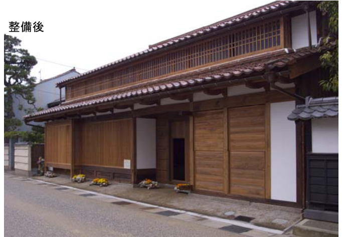
写真 淀屋牧田家（倉吉打吹地区最古の町屋）