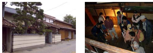
写真 淀屋牧田家整備後 写真 淀屋牧田家の一般公開

明倫地区・東岩倉地区を含め文化財建造物のすばらしさや歴史風土を伝える場として活用し、打吹玉川伝統的建造物群保存地区とあわせた交流の場とする。