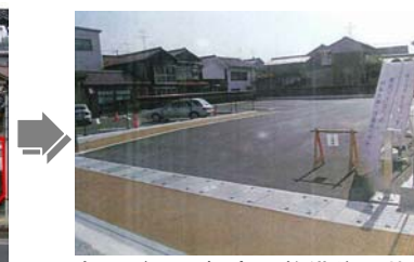
バス回転広場・バス待機所整備予定地