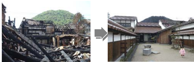
写真 くら用心整備前(H15火災) 写真 くら用心後(北向き)

住民すべての参加を目指すものの、一方で、地区住民の高齢化や独居化は参加者の固定化につながり複数回の出席が困難な状態もある。一人でも多くの参加を呼びかけ、住民の防災意識の向上を図る。