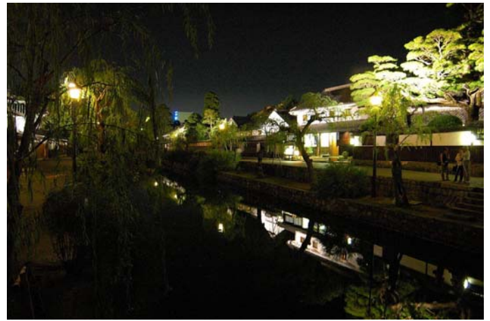
写真 美観地区夜間照明施設整備