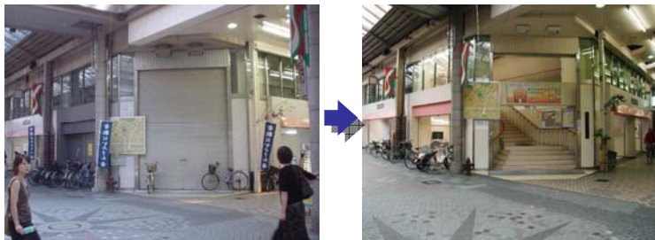
写真 倉敷まちづくりセンターの状況

～使われていなかった2階部分をまちづくりセンターに活用～ ・基幹：既存建築物活用事業（倉敷まちづくりセンター整備）