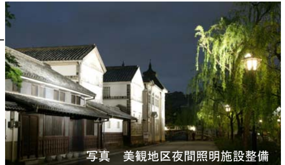
写真 美観地区夜間照明施設整備