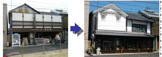
写真 ファサード整備前後の状況