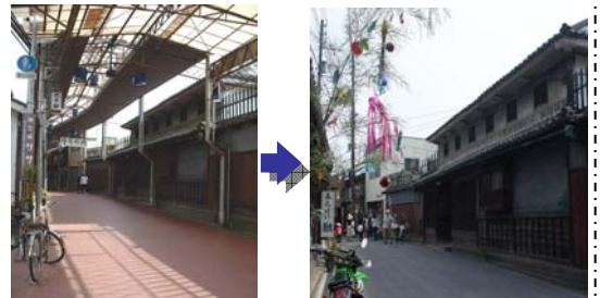
写真 アーケード撤去前後の状況