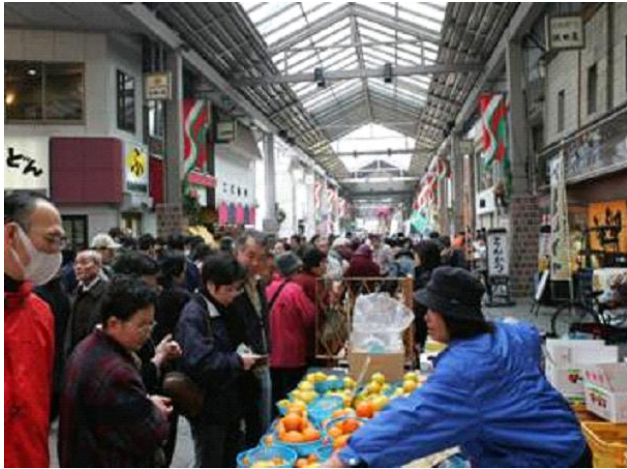
写真 くらしき朝市三斎市の開催