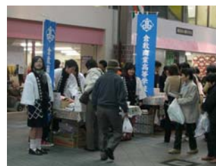
写真 地元学生の活動