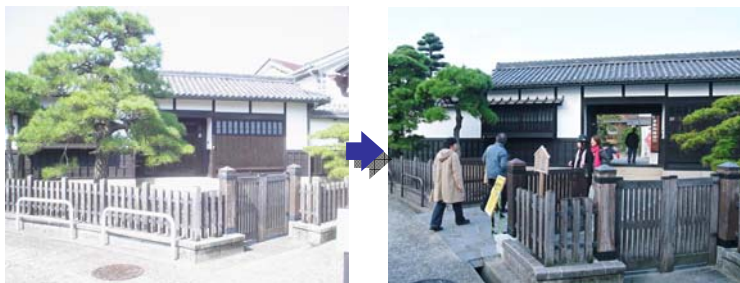
写真 観光交流センターの状況

～活用されていなかった旧民家の門が開かれ観光客が来訪～ ・基幹：既存建築物活用事業（高次都市施設）（+提案） （観光交流センター整備_倉敷物語館）