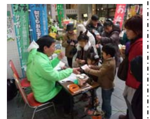
写真 ボランティアによる活動