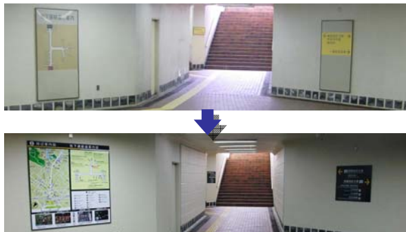
写真 地下道案内板の設置状況

～殺風景な地下道案内板から観光情報板に変更～ ・提案：地域創造支援事業 （倉敷駅前地下道情報案内施設整備事業）