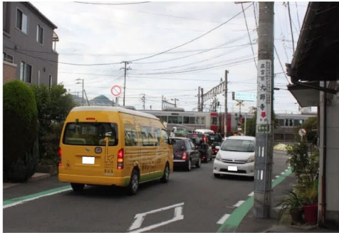
大正通第1踏切(海田町)の渋滞状況