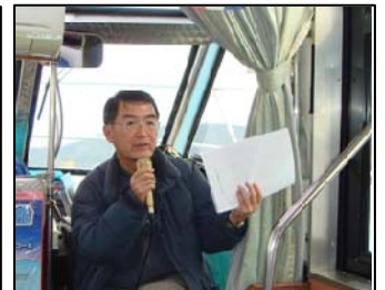
岡崎氏による見どころ等のご案内