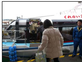
クルーズ船「くれない2」