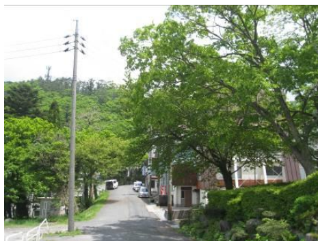
整備前の状況(道路美装化)