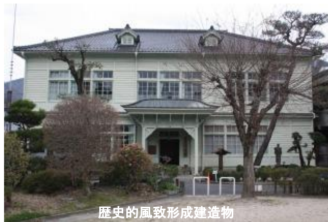
歴史的風致形成建造物