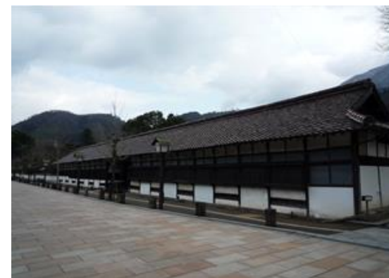
歴史的風致形成建造物(藩校養老館)整備