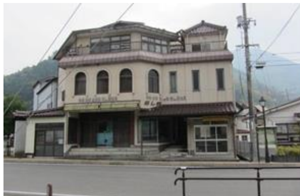
小公園整備(現建物を撤去後、小公園の整備)