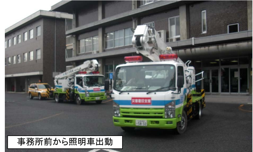
事務所前から照明車出動