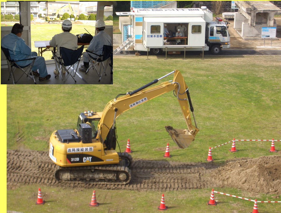
遠隔操縦装置(バックホウ用)訓練状況(H24年度)