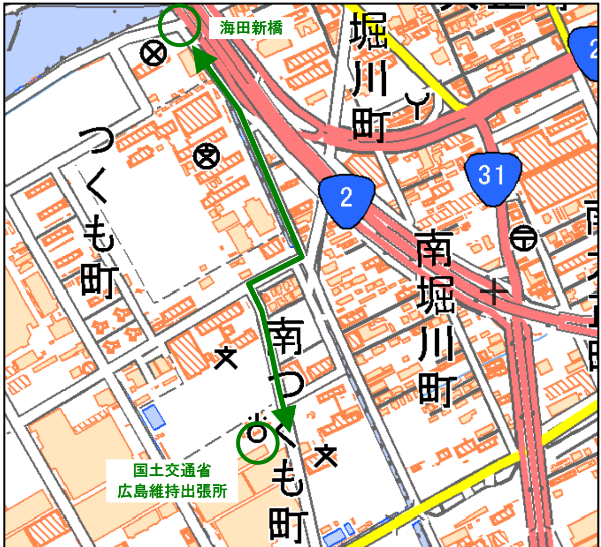
出展：地理院地図（電子国土 WEB）をもとに中国技術事務所加工