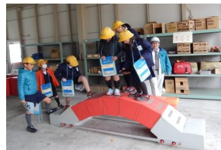
【アーチ橋体験（模型）】