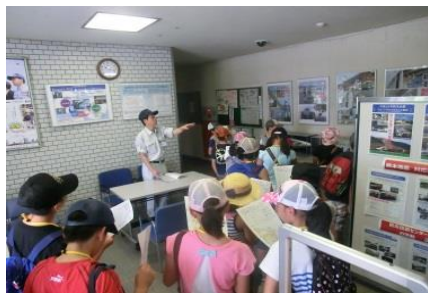
【東日本大震災（被災物品）】