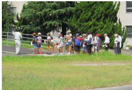
【バリアフリー体験施設】