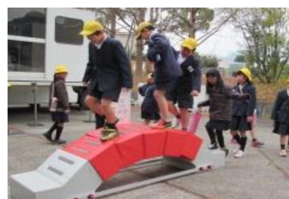
【アーチ橋体験（模型）】