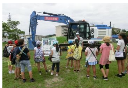
【分解組立型バックホウ】