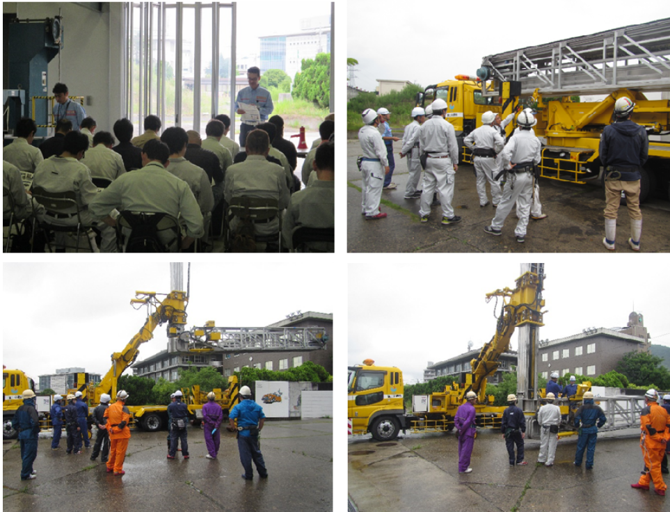
橋梁の下の点検を想定したアーム操作実施状況