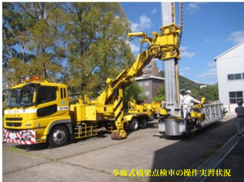
令和2年度講習会の実施状況