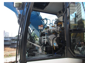
(遠隔操縦装置取付状況)