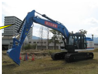
分解組立型BH (バックホウ)