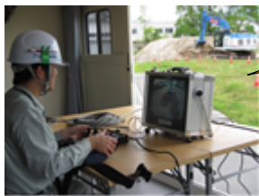
(モニターによる遠隔操作)