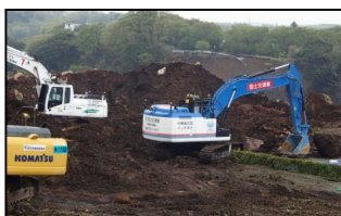
平成28年4月熊本地震(熊本県阿蘇郡南阿蘇町)