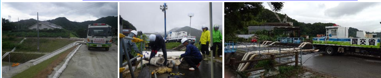
令和3年8月豪雨 活動状況（広島県内）

http://www.cgr.mlit.go.jp/ctc/topics/event/2022index.htm