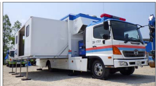
対策本部車 (拡幅型)