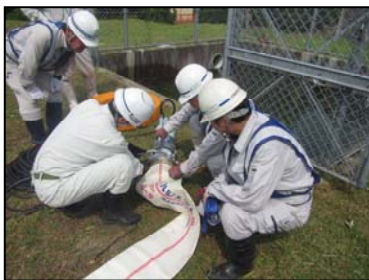
排水ポンプ車 (30m 3 /min)