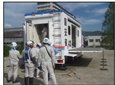
対策本部車 (拡幅型)