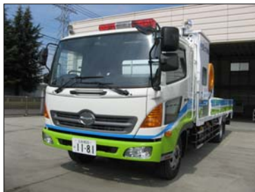
排水ポンプ車 (30m 3 /min)

■ そ の 他 : ・取材日の訓練はすべて公開で実施します。 ・取材を希望される場合は、事前に下記問合せ先までご連絡頂きますようお願いいたします。