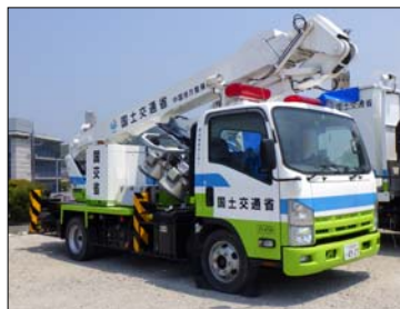
照明車 (2kW×6 灯)