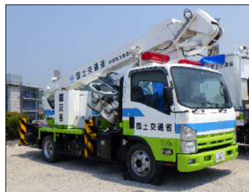
照明車 (2kW×6 灯)