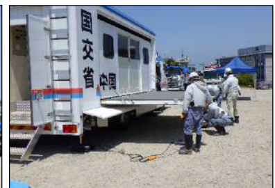
対策本部車(拡幅型)