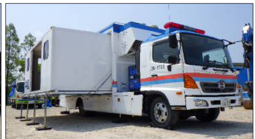
対策本部車 (拡幅型)