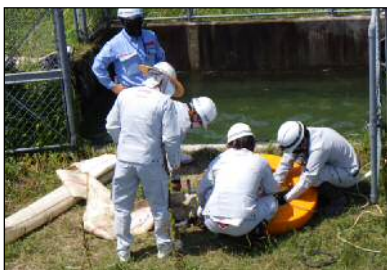
排水ポンプ車(30m 3 /min)