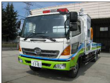
排水ポンプ車 (30m 3 /min)