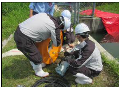
排水ポンプ車(30m 3 /min)