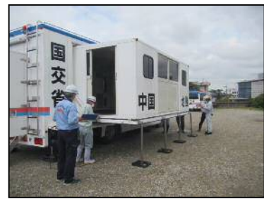
対策本部車(拡幅型)