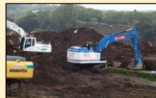
●H28年4月 熊本地震(熊本県阿蘇郡南阿蘇村)阿蘇大橋崩落箇所にて遠隔操縦(無人化施工)による土砂撤去作業を実施。