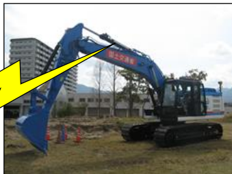
分解組立型バックホウ