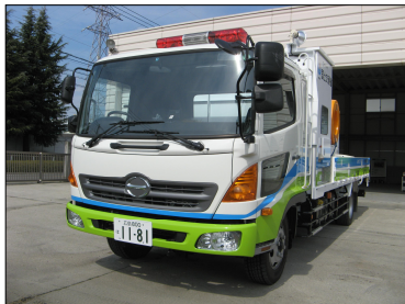
排水ポンプ車 (30m 3 /min)

■ そ の 他 : ・取材日の訓練はすべて公開で実施します。 ・取材を希望される方は、事前に下記問合せ先まで連絡をお願いします。