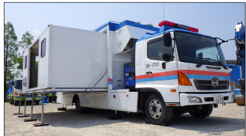
対策本部車 (拡幅型)