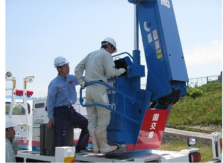
照明車 (2 kW × 6 灯)