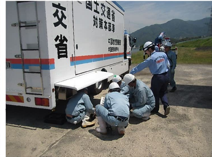
対策本部車 (拡幅型)