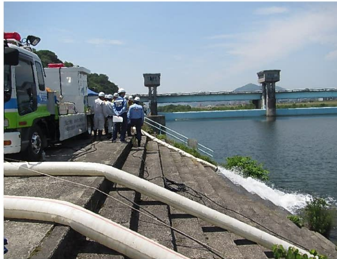
排水ポンプ車 (30 m 3 /min)