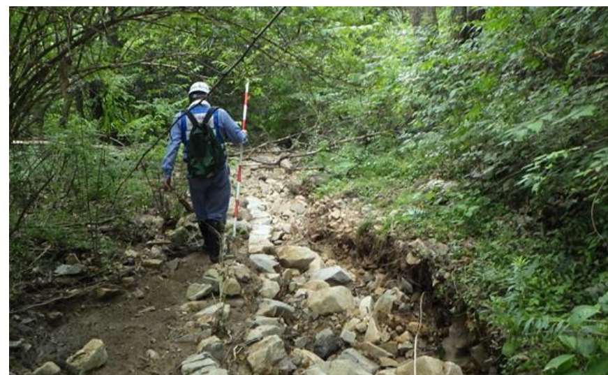
被災状況調査(熊野町)