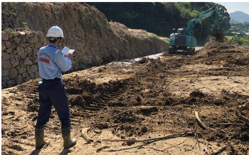
道路啓開(呉市安浦町)