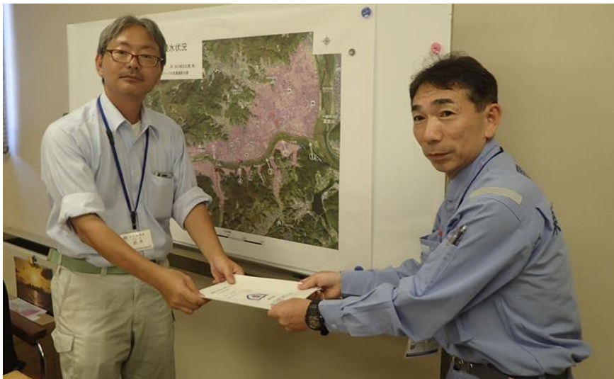
東北地整から倉敷市へ調査結果の報告