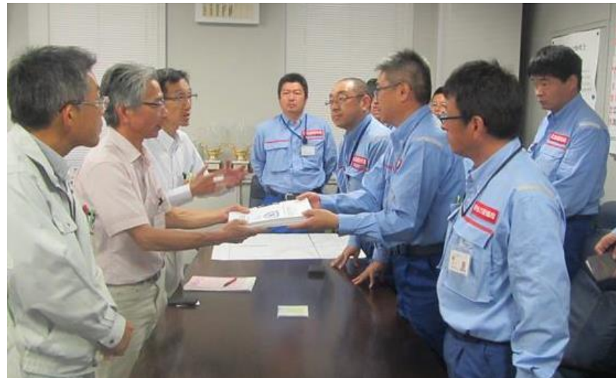
北海道開発局から広島県へ調査結果の報告