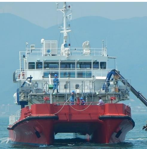
九州地整所属 『がんだりゅう』