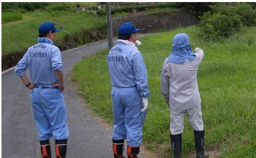
地元住民からの聞き取り(新見市)