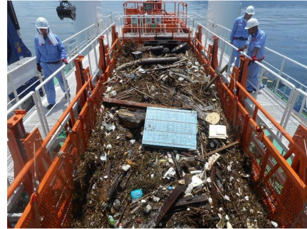
漂流物の回収状況