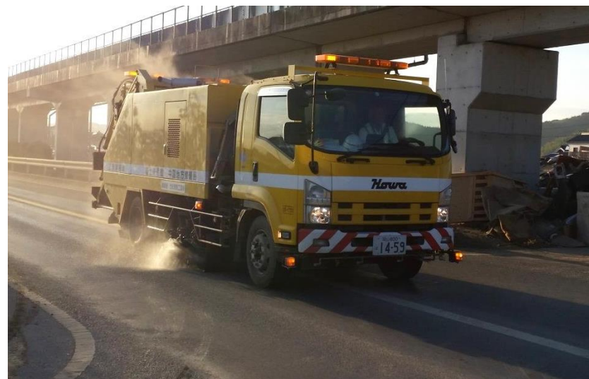
路面高圧洗浄（倉敷市真備町）