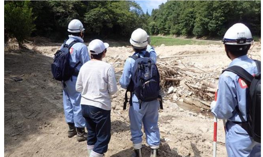
地元住民からの聞き取り(三原市)