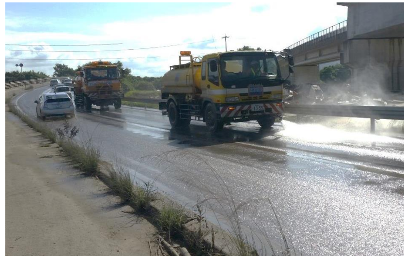
散水作業（倉敷市真備町）