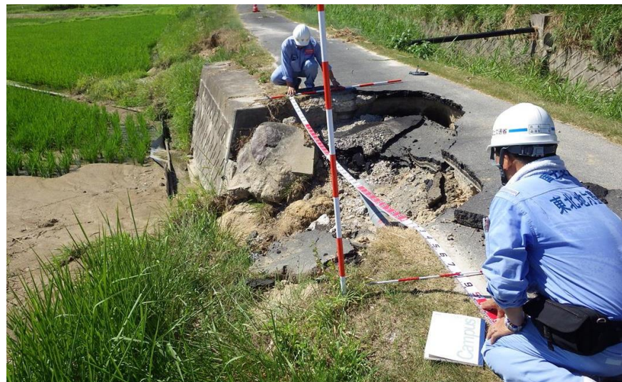
被災状況調査(矢掛町)