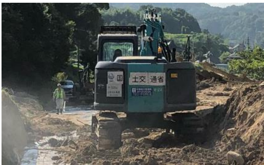
道路啓開(呉市安浦町)