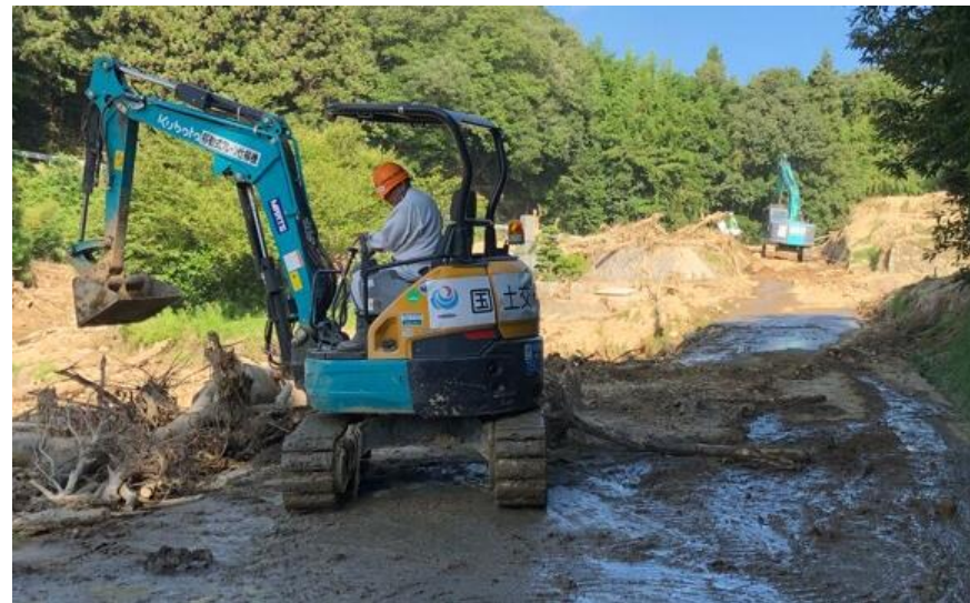
道路啓開(呉市安浦町)