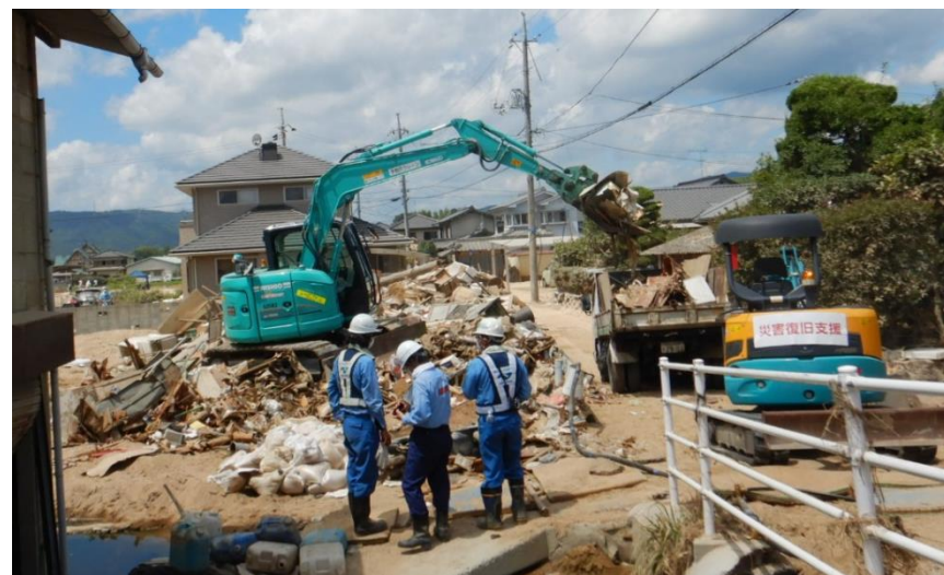
水路啓開作業(倉敷市真備町)