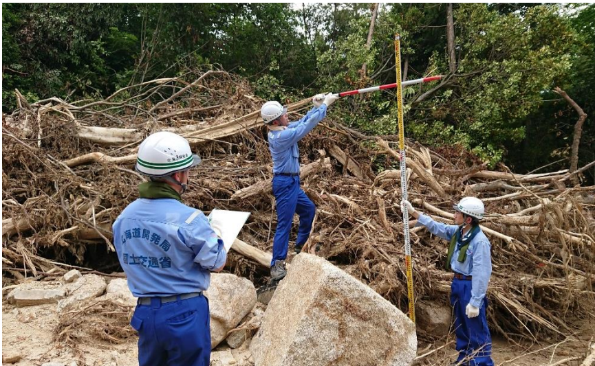
被災状況調査(東広島市)