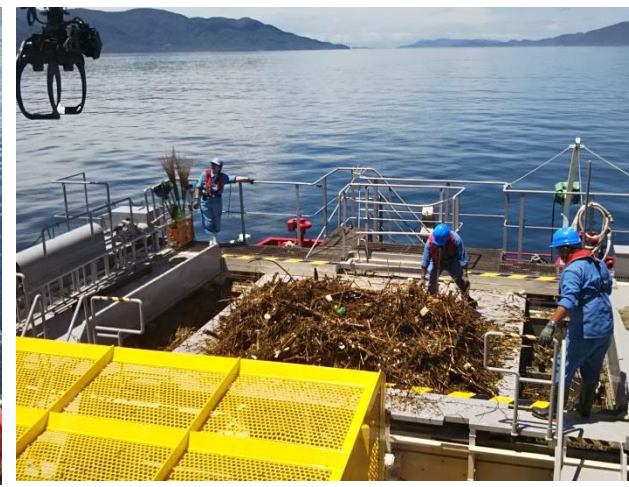
漂流物の回収状況