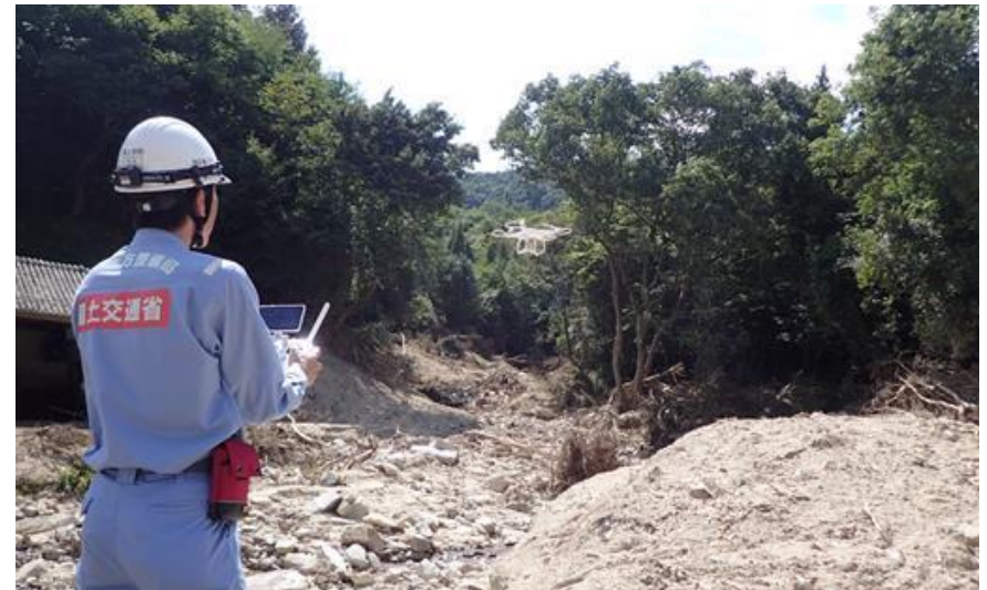
被災状況調査(三原市)