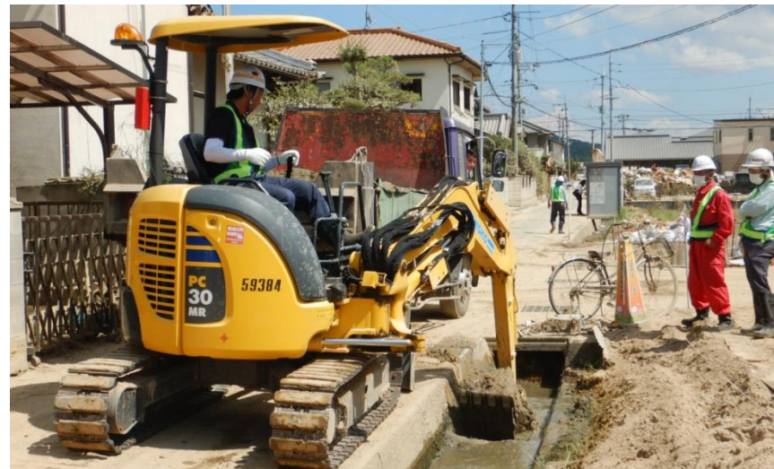
水路啓開作業(倉敷市真備町)