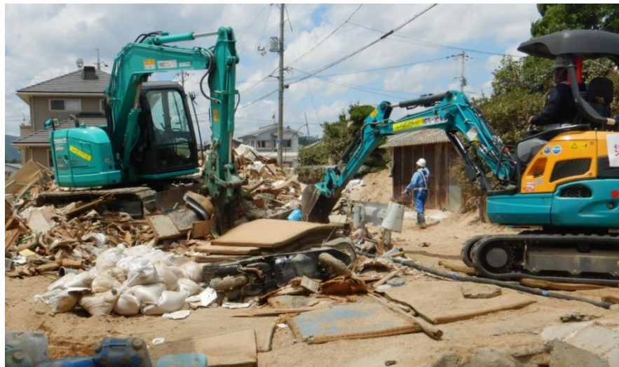
水路啓開作業(倉敷市真備町)