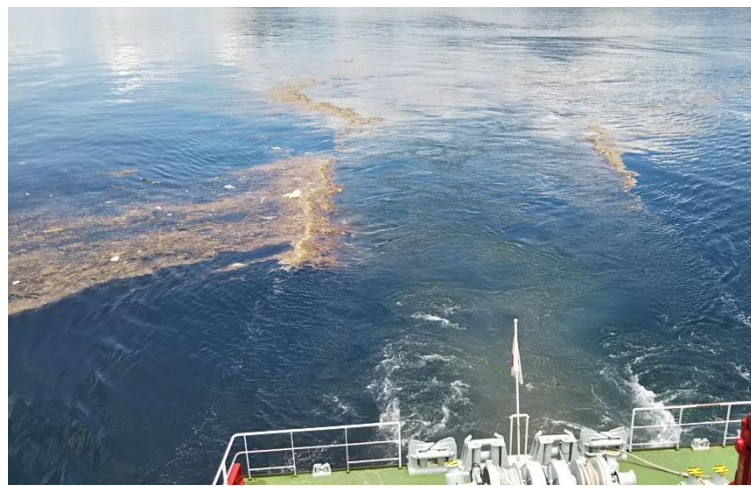
広島湾の南方海域の平郡水道の漂流物状況