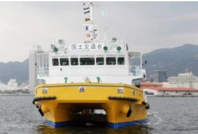
近畿地整所属 『Dr.海洋』