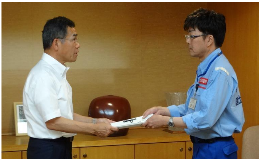
北海道開発局から福山市長へ調査結果の報告