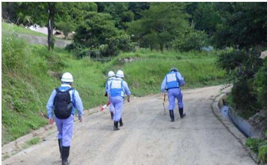
被災状況調査(東広島市)