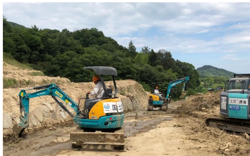
道路啓開(呉市安浦町)