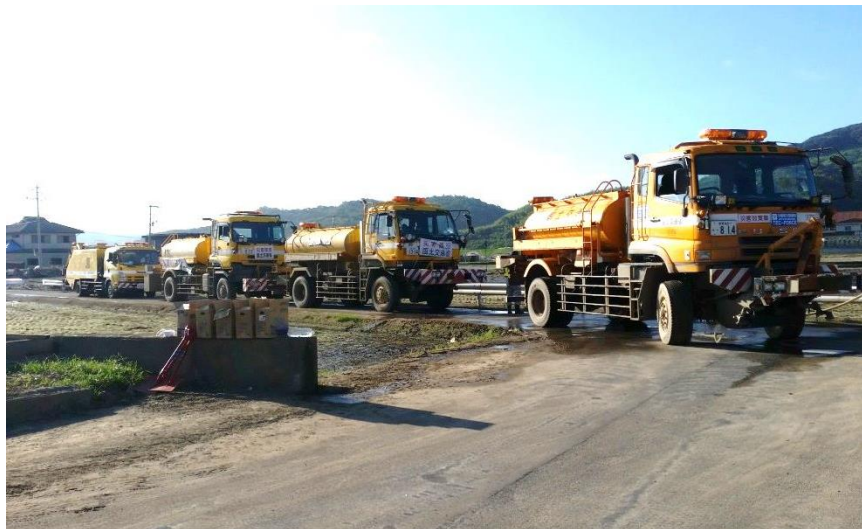
散水作業（倉敷市真備町）