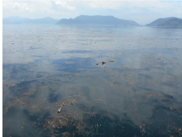
蒲刈港（呉市）沖合の漂流物状況