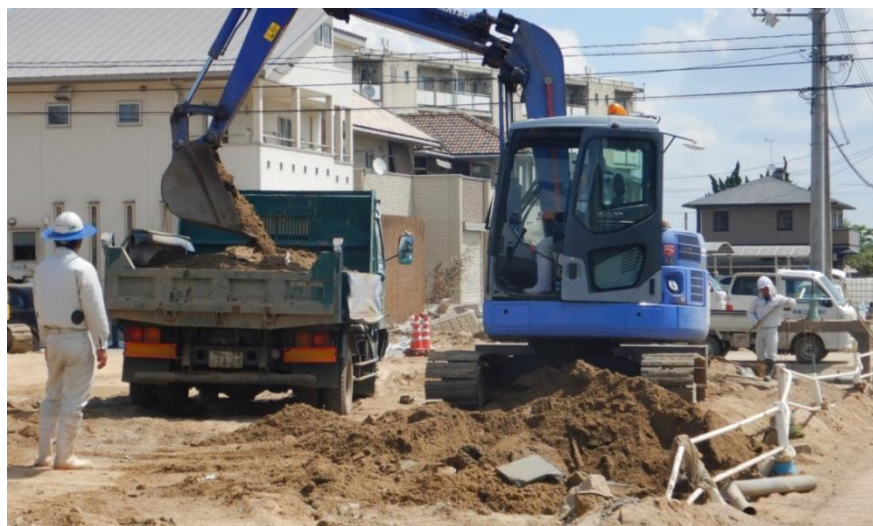
水路啓開作業(倉敷市真備町)