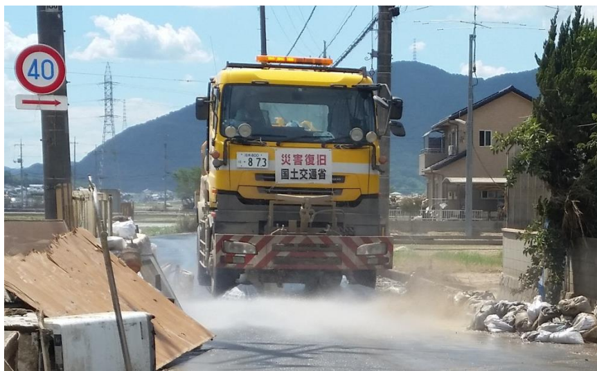
路面清掃（倉敷市真備町）