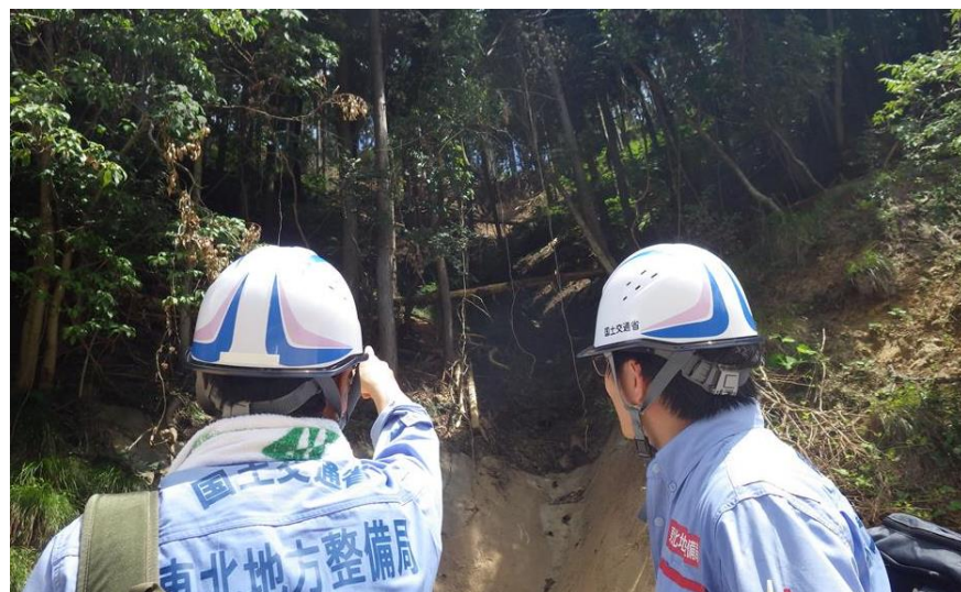
被災状況調査(美作市)