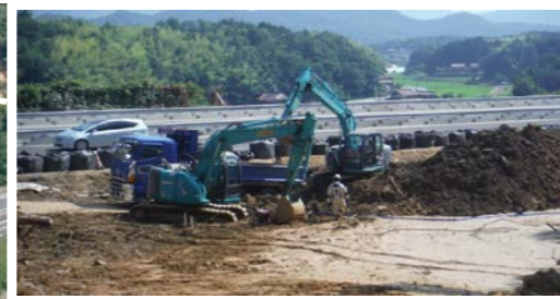
④ 東広島市高屋町 内容：道路啓開支援