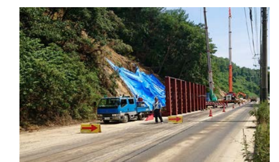
⑥ 尾道市美ノ郷町 内容：道路啓開支援