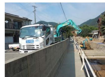
⑦ 呉市天応町 内容：土砂撤去支援