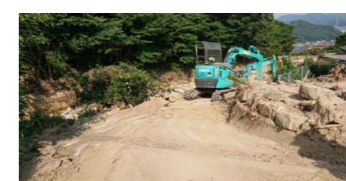
⑤ 三原市木原町 内容：道路啓開支援