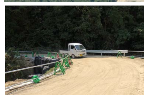
③ 呉市安浦町 内容：道路啓開支援