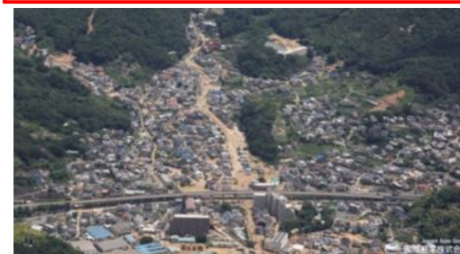
⑦ 呉市天応町：堆積土砂撤去支援