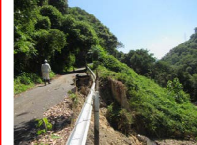
⑧ 福山市郷分町：道路啓開支援