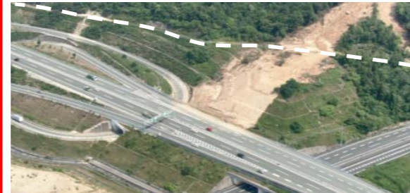
④ 東広島市高屋町：道路啓開支援