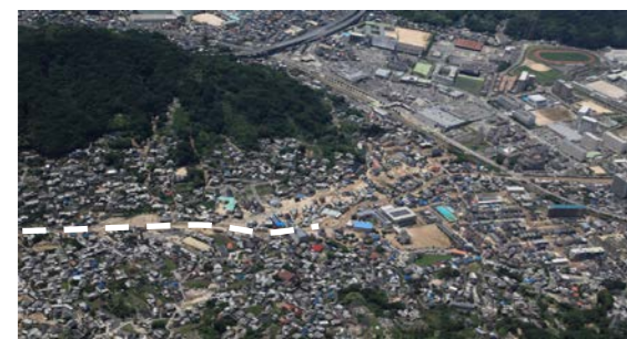
⑨ 坂町坂西：堆積土砂撤去支援