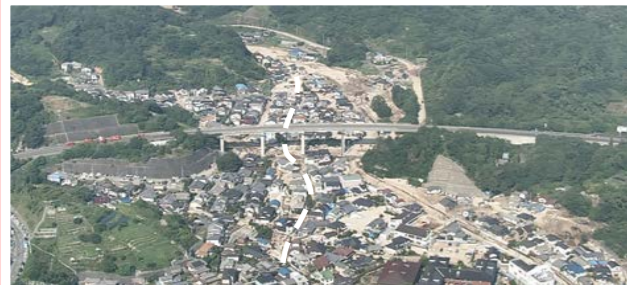
① 坂町小屋浦：道路啓開支援 全体マネジメント