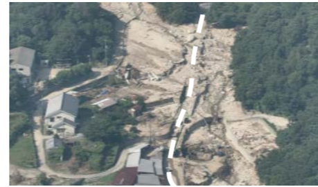
② 呉市川尻町：道路啓開支援