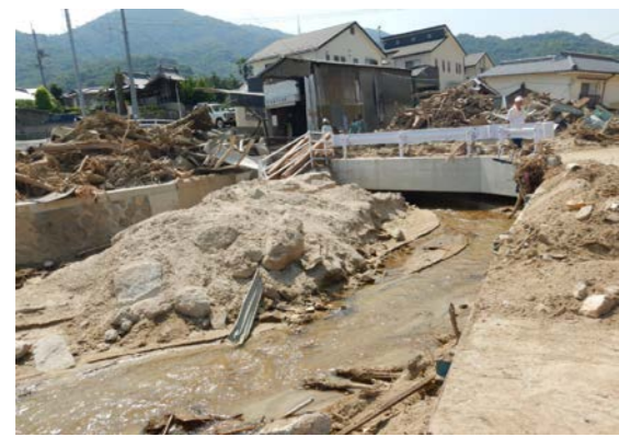
⑨ 坂町坂西 内容：土砂撤去支援