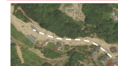
⑤ 三原市木原町：道路啓開支援