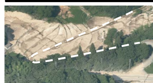
③ 呉市安浦町：道路啓開支援