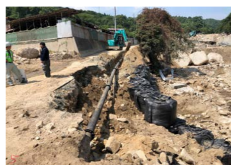
② 呉市川尻町 内容：道路啓開支援