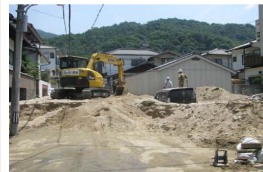
① 坂町小屋浦 内容：道路啓開支援 全体マネジメント