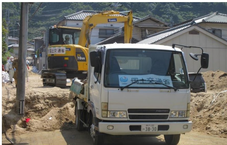
道路啓開作業（安芸郡坂町小屋浦）