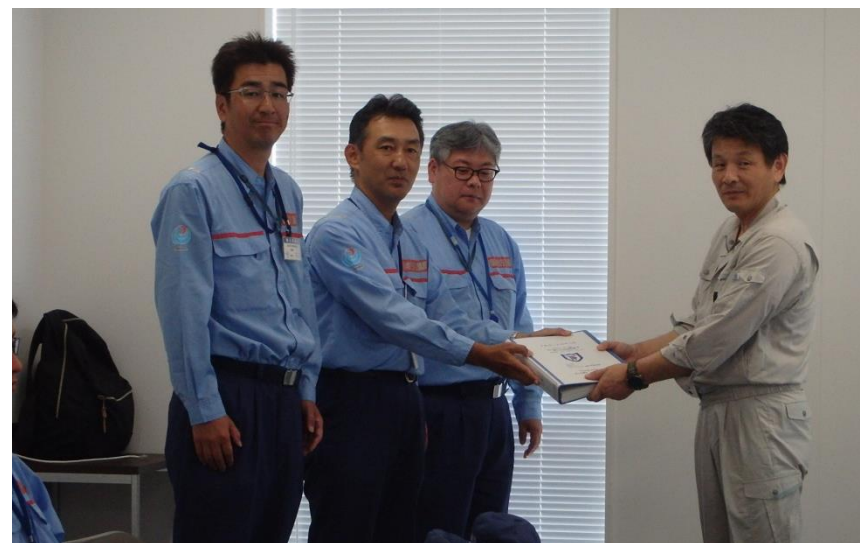
中国地整から東広島市への調査結果の報告