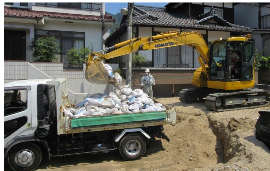
道路啓開作業（安芸郡坂町小屋浦）