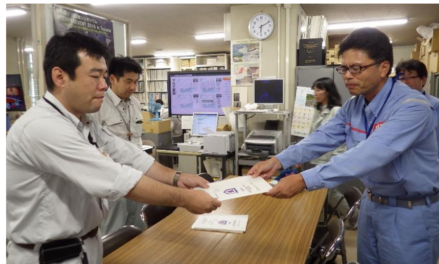
東北地整から広島県砂防課担当者へ調査結果の報告