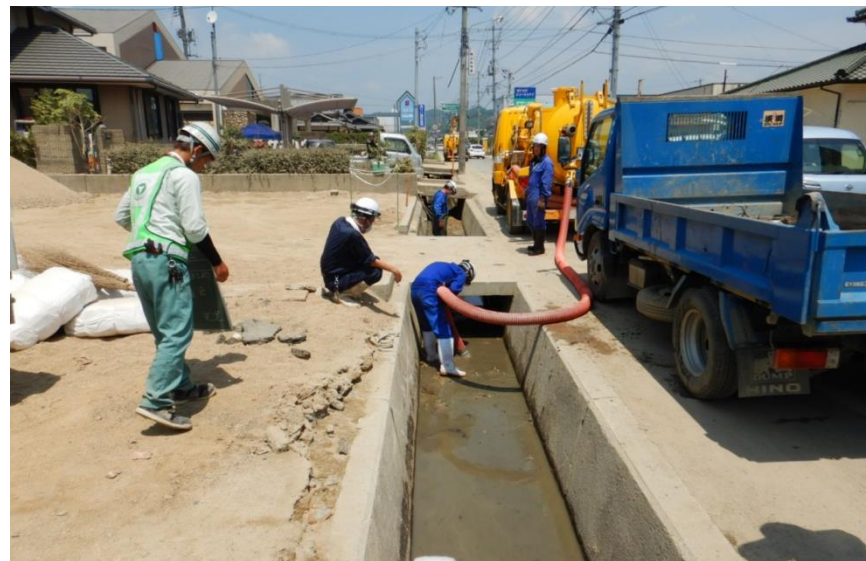
水路啓開作業（倉敷市真備町）