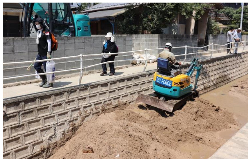
水路啓開（呉市天応）