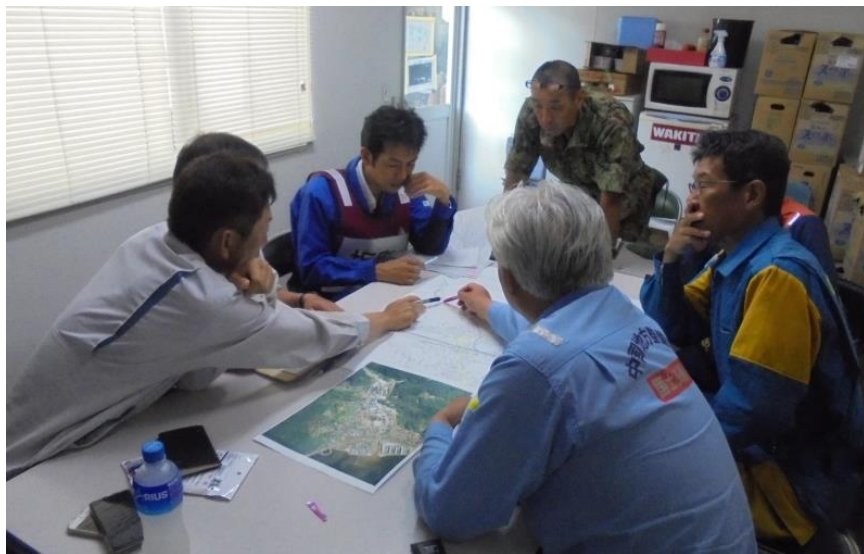
道路啓開作業打合せ（安芸郡坂町小屋浦）