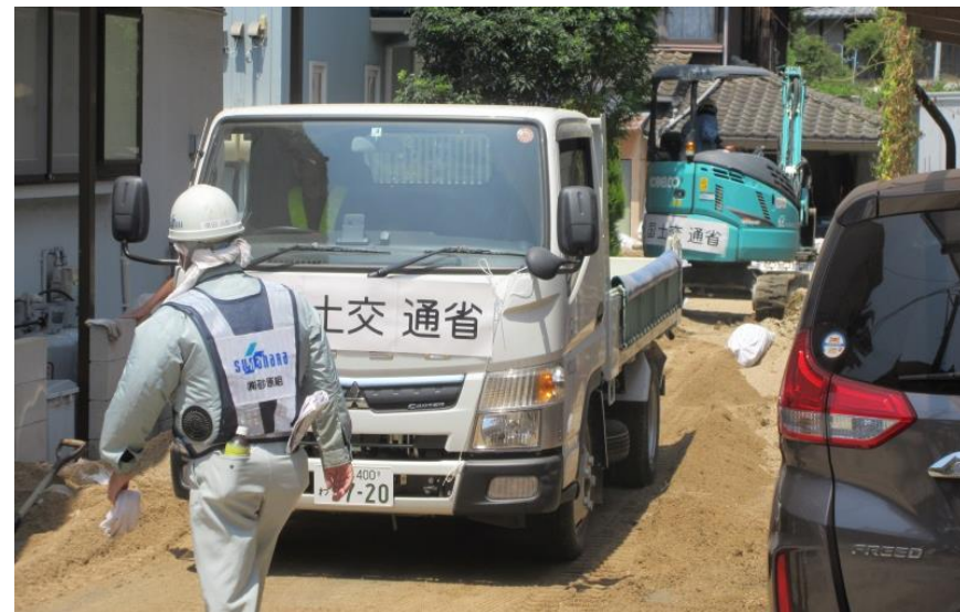
道路啓開作業（安芸郡坂町小屋浦）