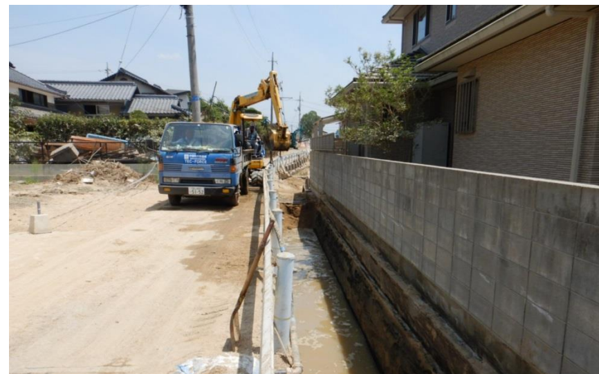
水路啓開作業（倉敷市真備町）