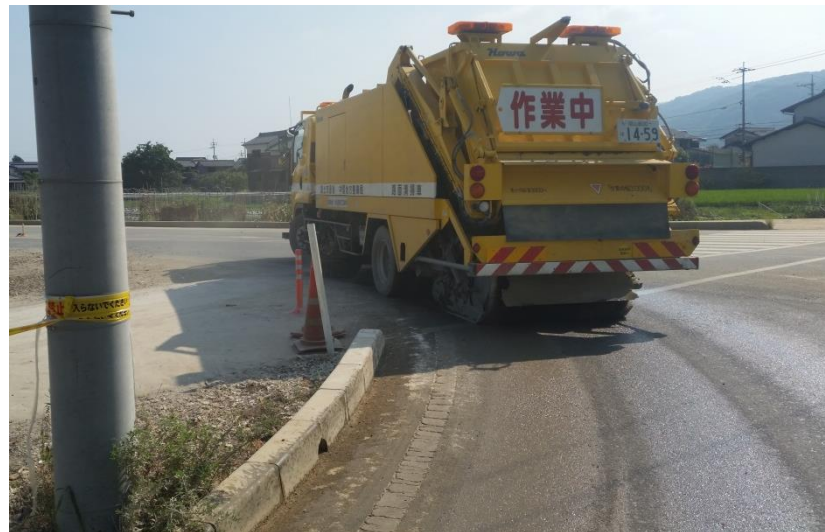
清掃作業（倉敷市真備町）