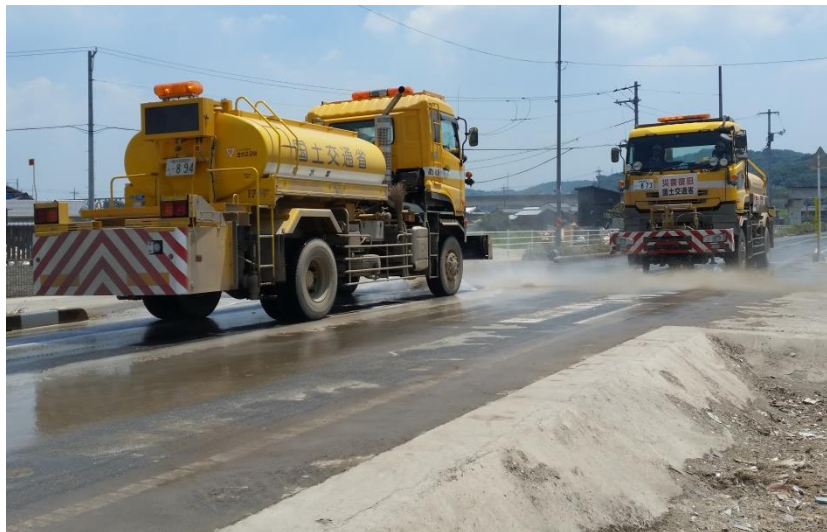
散水作業（倉敷市真備町）