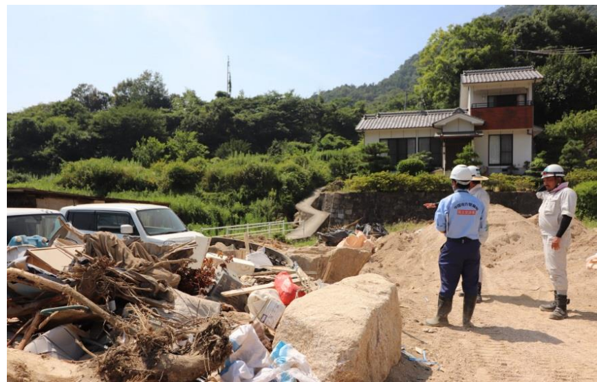
啓開作業打合せ（呉市天応）