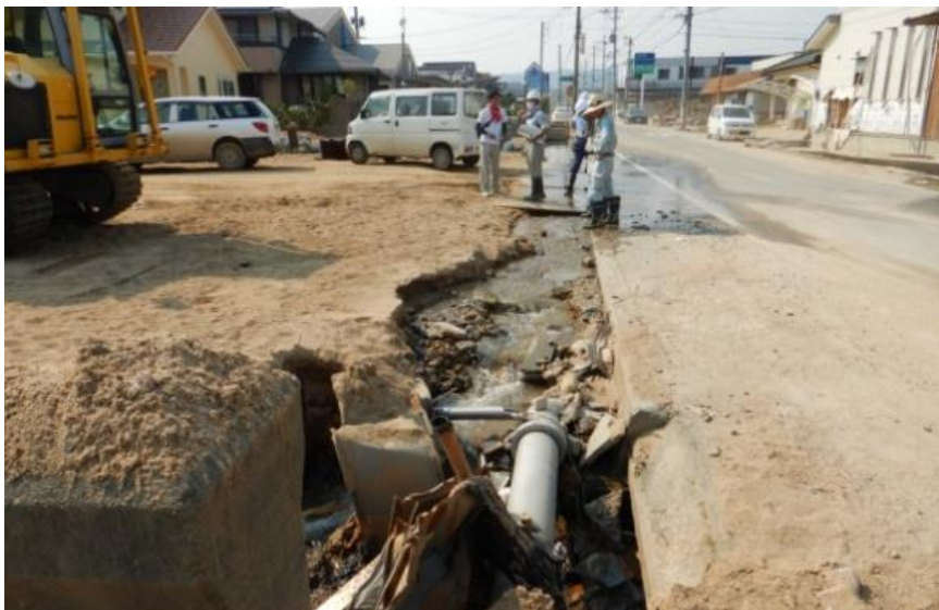
水路啓開作業打合せ（倉敷市真備町）