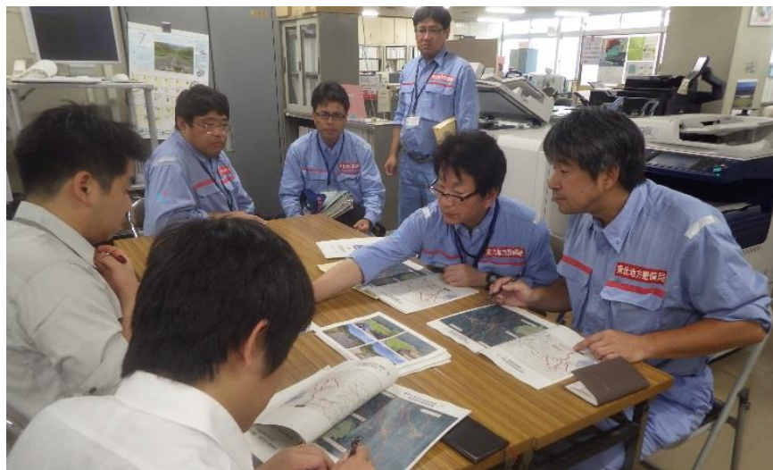
東北地整から広島県砂防課担当者へ調査結果の説明