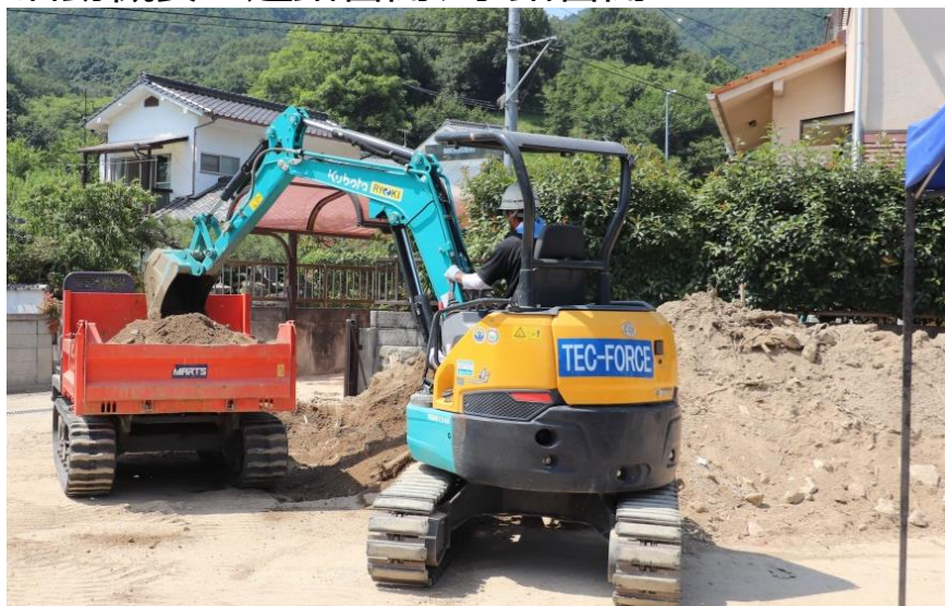
道路啓開（呉市天応）