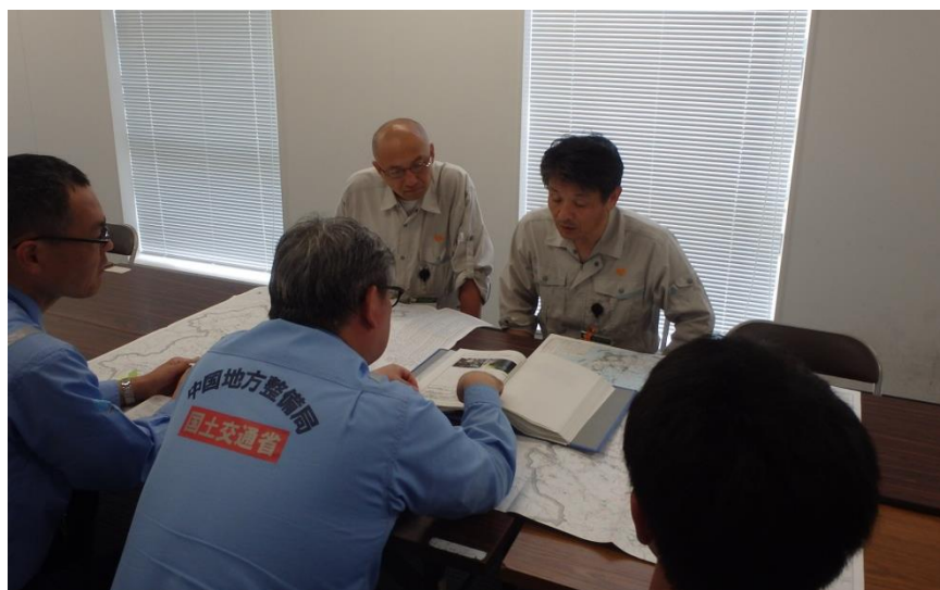
中国地整から東広島市担当者への調査結果の説明