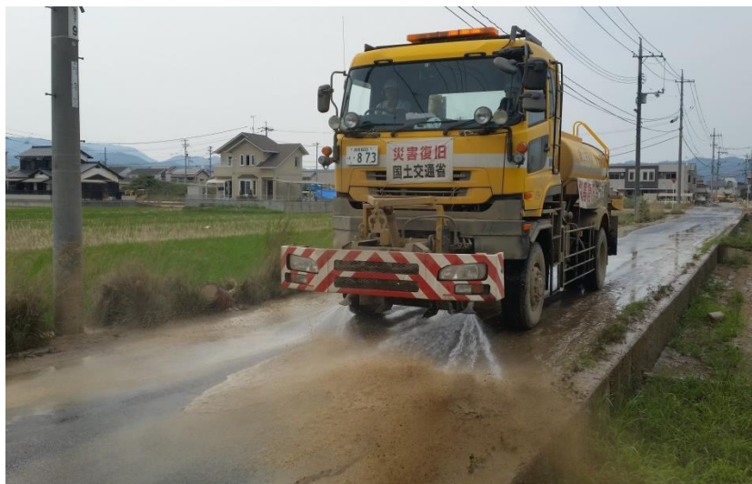
散水作業（倉敷市真備町）