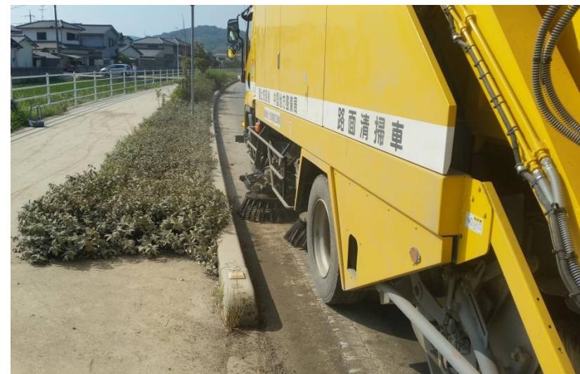
清掃作業（倉敷市真備町）