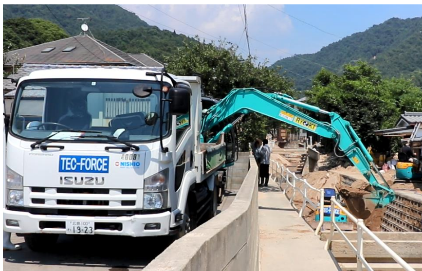
水路啓開（呉市天応）