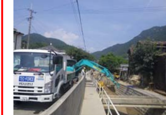
⑦ 呉市天応町 内容：土砂撤去支援