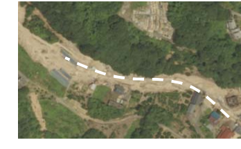
⑤ 三原市木原町：道路啓開支援