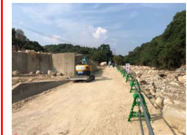
② 呉市川尻町 内容：道路啓開支援