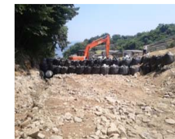
⑤ 三原市木原町 内容：道路啓開支援