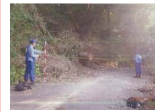
⑧ 福山市郷分町：道路啓開支援