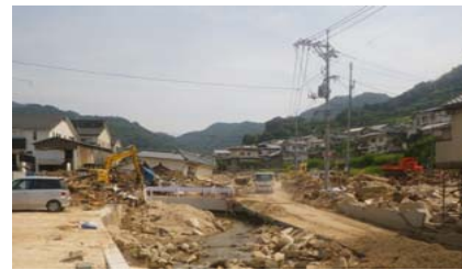
⑨ 坂町坂西 内容：土砂撤去支援