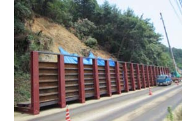
⑥ 尾道市美ノ郷町 内容：道路啓開支援