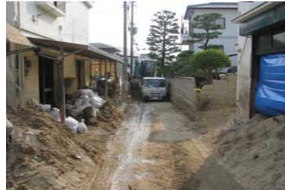
① 坂町小屋浦 内容：道路啓開支援 全体マネジメント