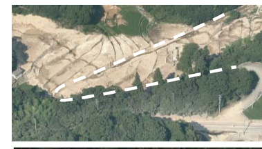
③ 呉市安浦町：道路啓開支援