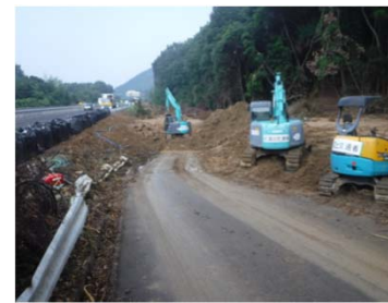
④ 東広島市高屋町 内容：道路啓開支援