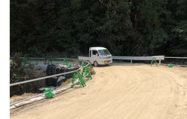
③ 呉市安浦町 内容：道路啓開支援