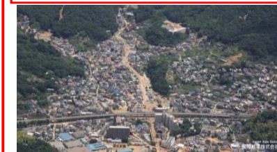
⑦ 呉市天応町：堆積土砂撤去支援