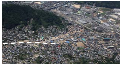
⑨ 坂町坂西：堆積土砂撤去支援