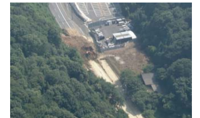
⑥ 尾道市美ノ郷町： 土工用防護柵設置支援