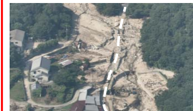
② 呉市川尻町：道路啓開支援