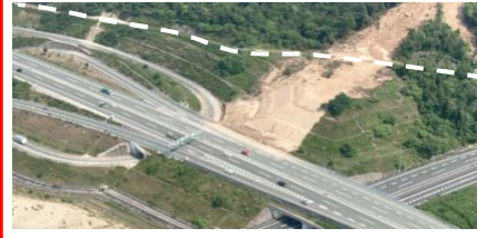
④ 東広島市高屋町：道路啓開支援