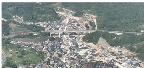
① 坂町小屋浦：道路啓開支援 全体マネジメント