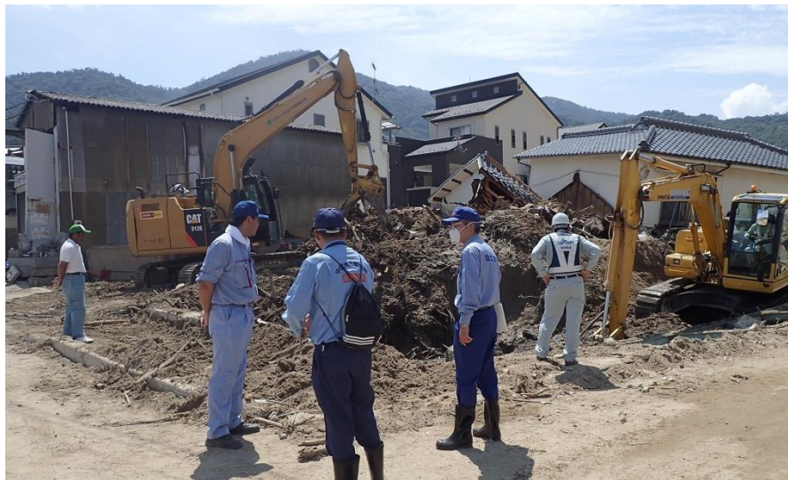
復旧作業現地確認（安芸郡坂町坂西）