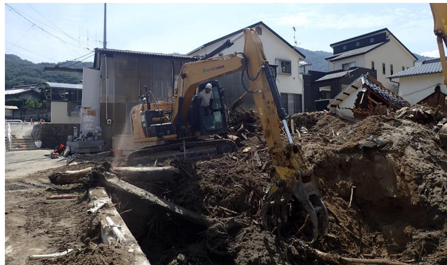
堆積土砂撤去（坂町坂西）