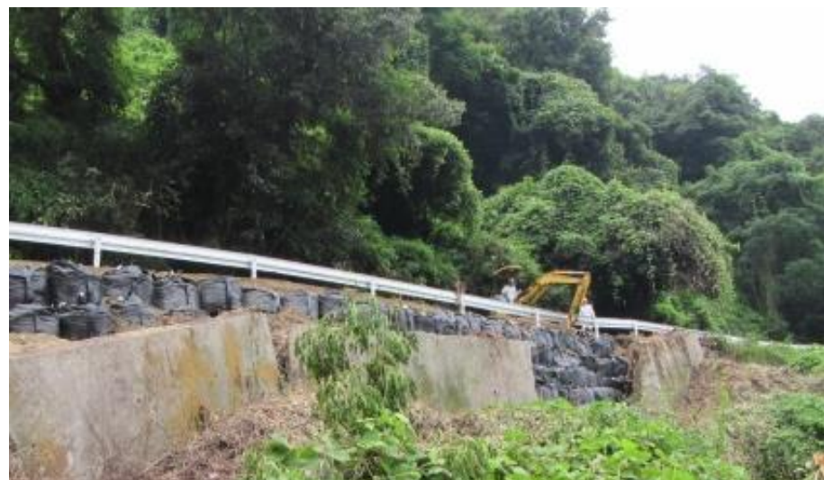
道路啓開作業（福山市郷分町）