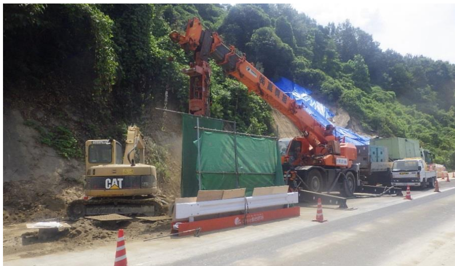
道路啓開作業（尾道市美ノ郷町）