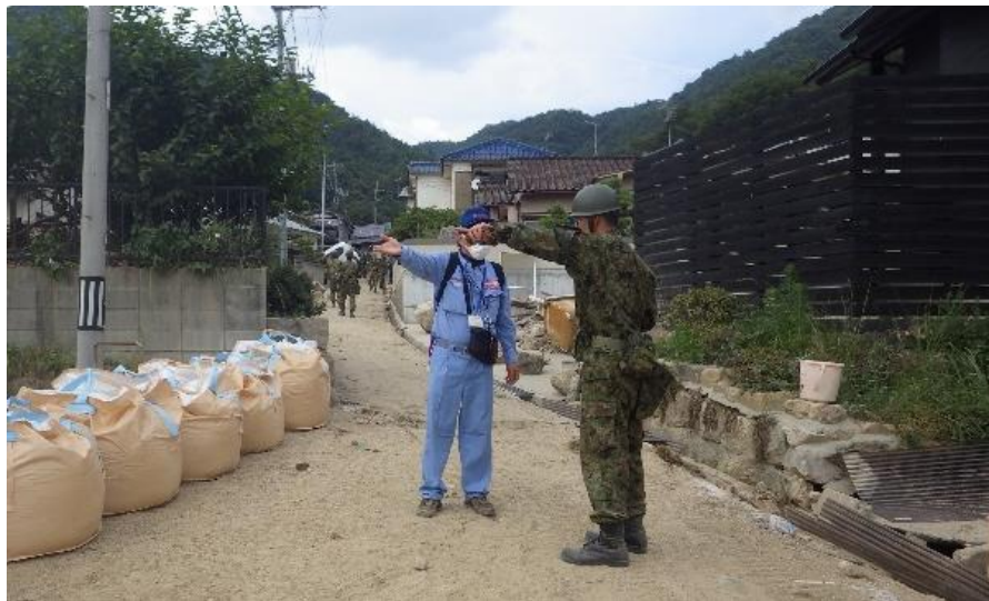
復旧箇所打合せ（呉市天応町）