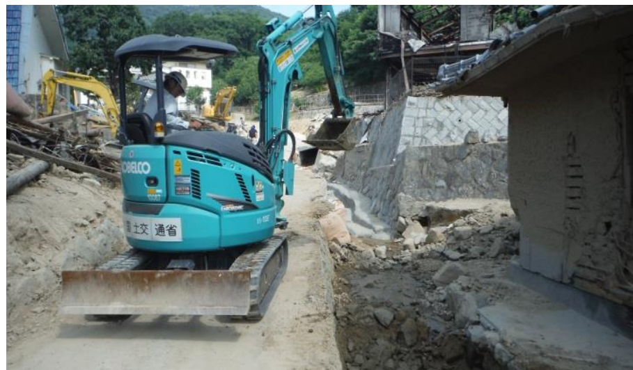
水路土砂撤去（三原市木原町）