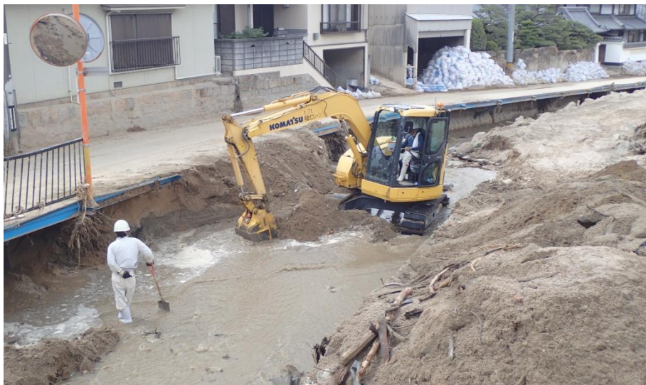
堆積土砂撤去（坂町坂西）