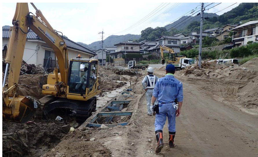
復旧作業現地確認（安芸郡坂町坂西）