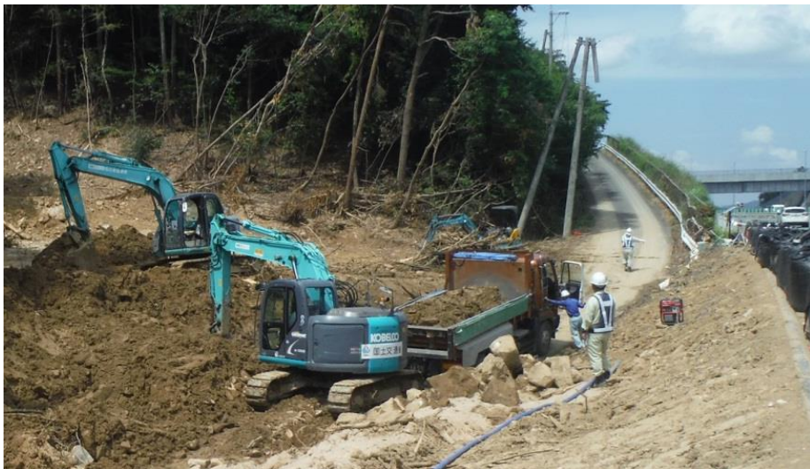
道路啓開作業（東広島市高屋町）