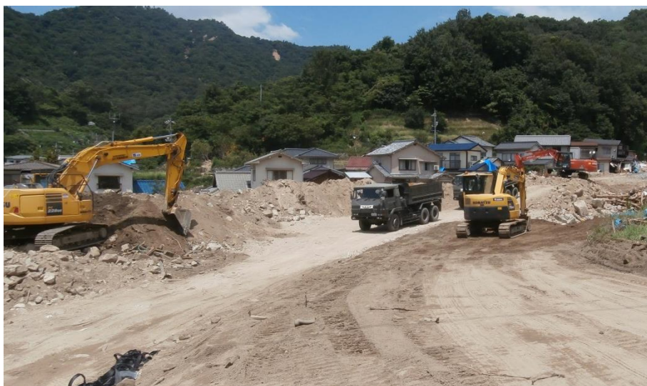
道路啓開（坂町小屋浦）