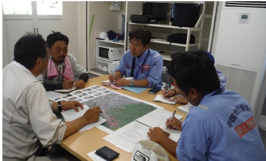
復旧作業打合せ（呉市天応町）