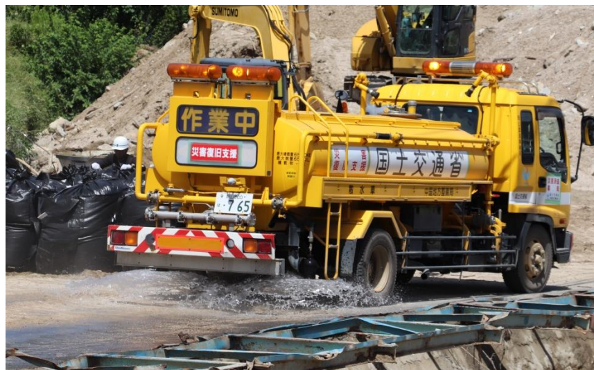
散水作業（坂町坂西）