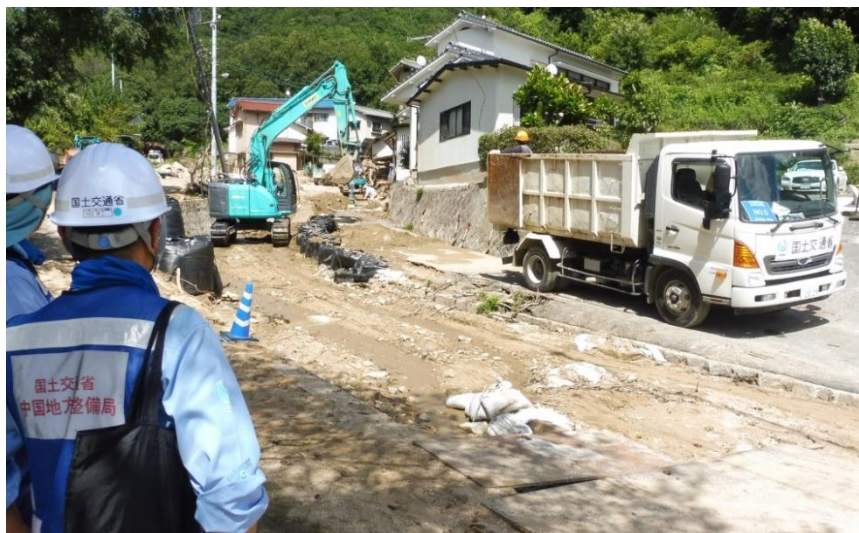
現地状況確認（呉市天応町）