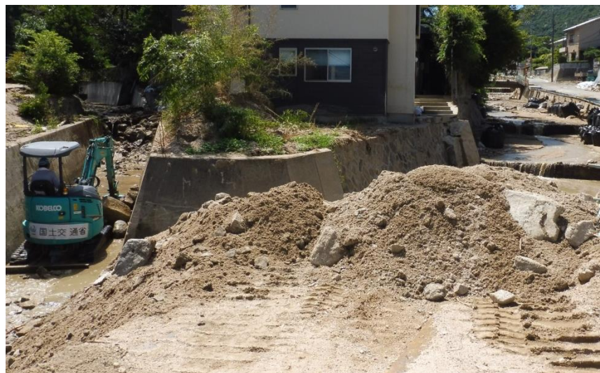
土砂撤去作業（坂町坂西）