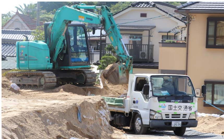
現地状況確認（坂町小屋浦）