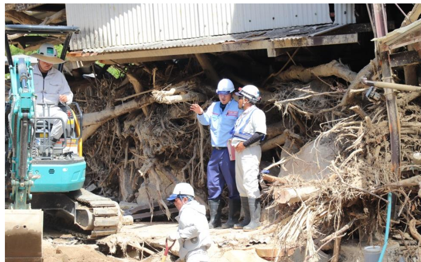
現地状況確認（呉市天応町）