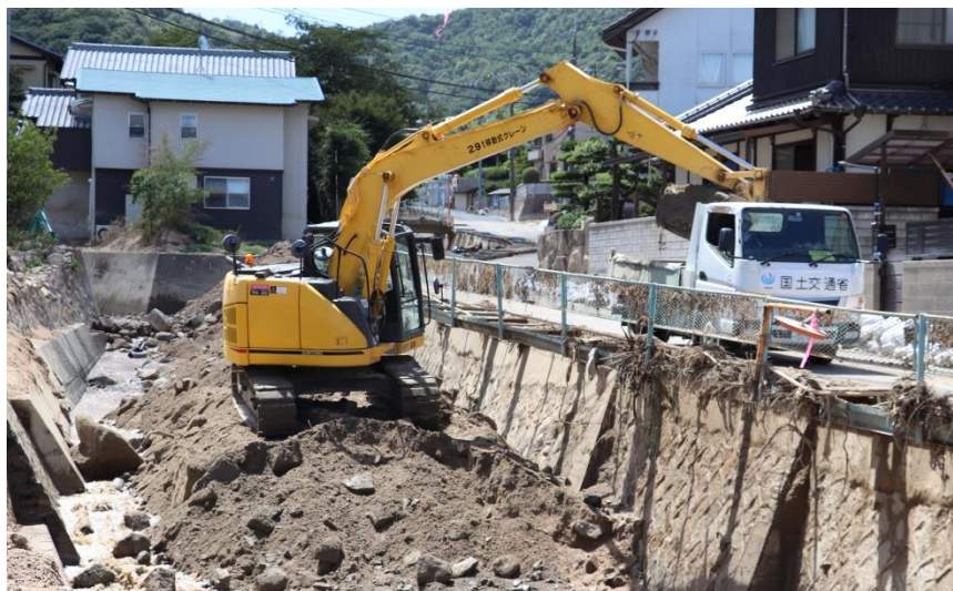
土砂撤去作業（坂町坂西）