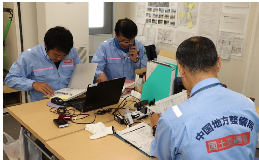
打合せ状況（呉市天応町）