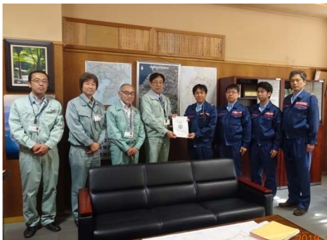
【調査報告を手交】 千葉県市原土木事務所（河川班）