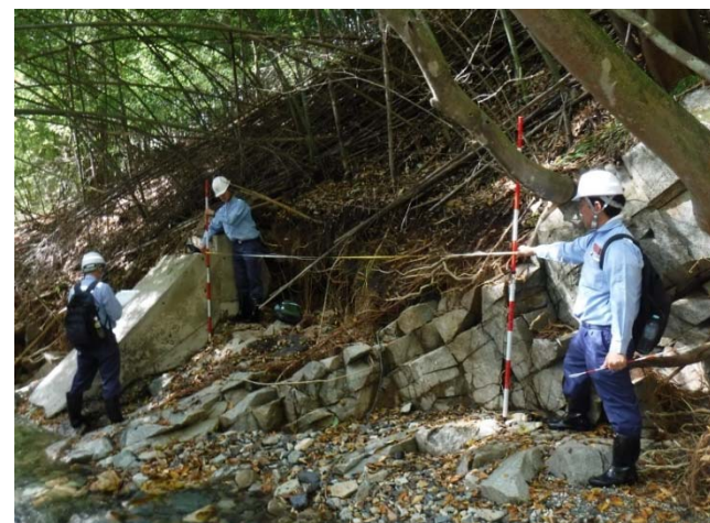
河川の被災状況を調査 （長野県佐久郡佐久穂町：河川班）