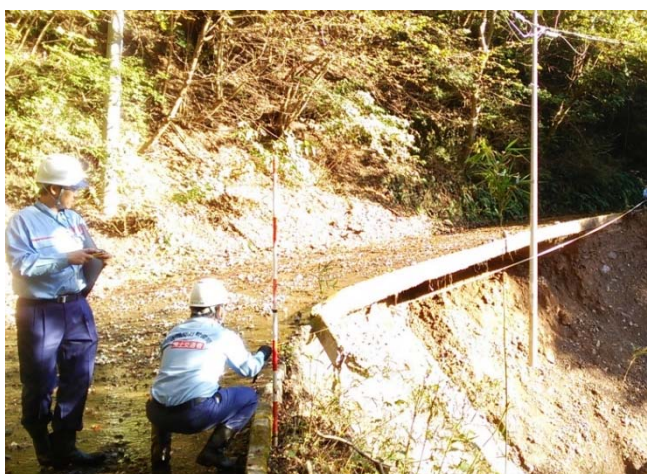
道路の被災状況を調査 （神奈川県相模原市：道路班）