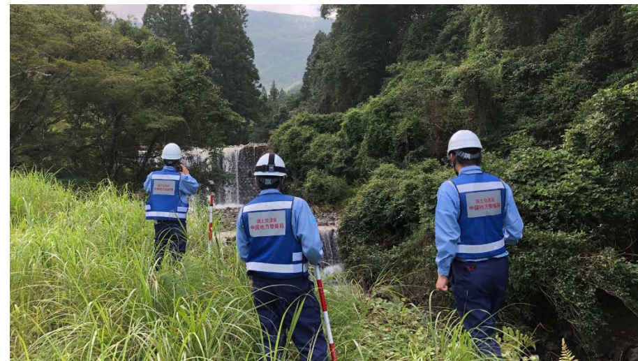
河川班による現地調査（熊本県あさぎり町）