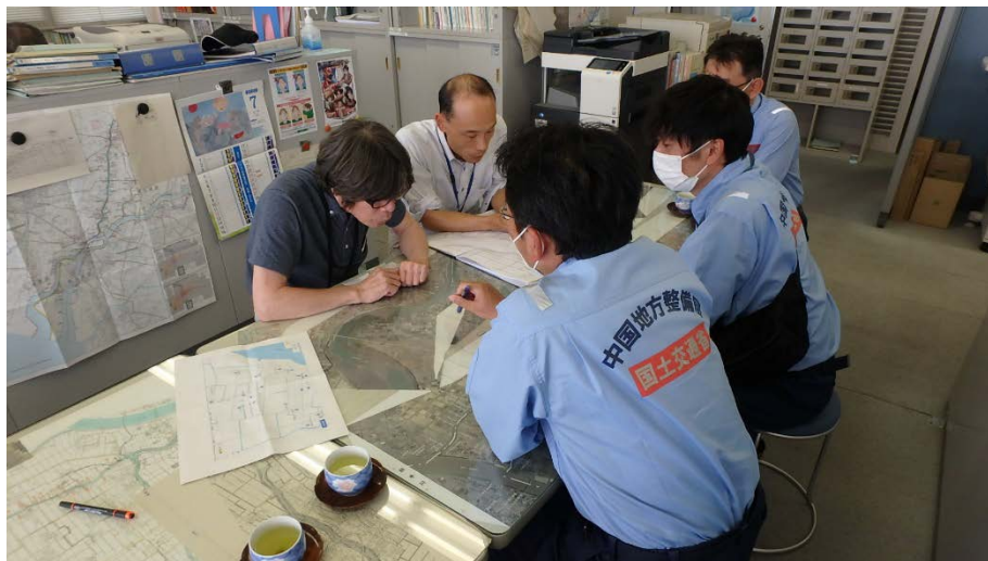
応急対策班の排水作業打合せ(筑後川河川事務所諸富出張所)