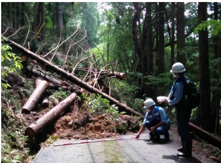
道路班による再被災等確認調査（人吉市）