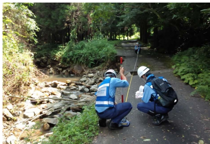
道路班による再被災等確認調査（球磨村）