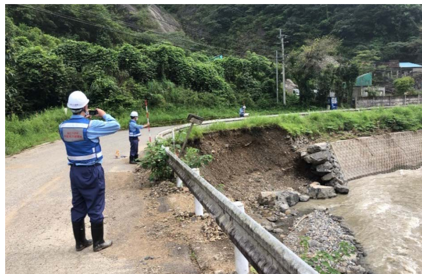
河川班による再被災等確認調査（球磨村）