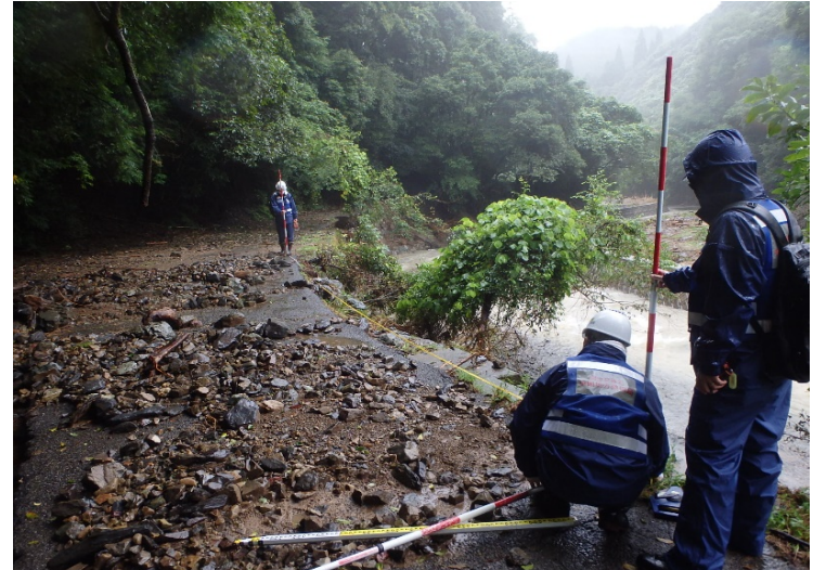
道路被災箇所の現地調査（熊本県人吉市）