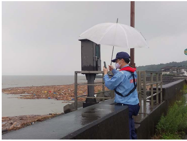
宇土半島近傍の漂流物撤去作業の確認