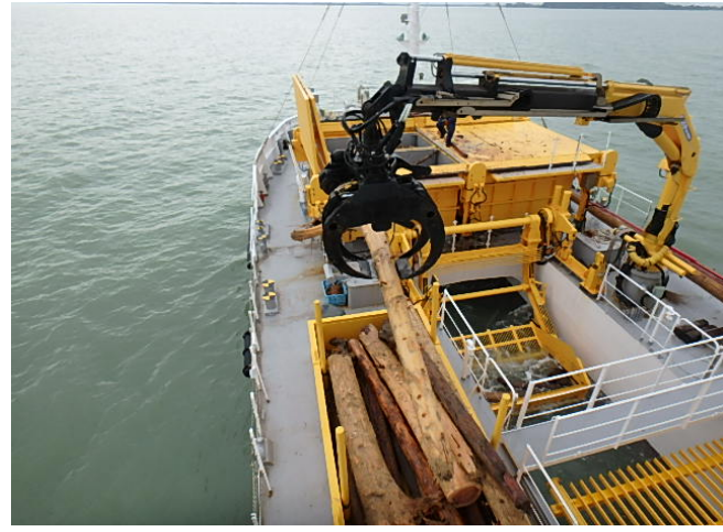
海洋環境整備船「海煌」による漂流物回収状況