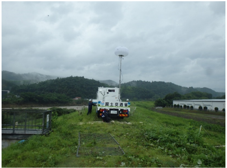
石井樋管への排水ポンプ車待機状況（大分県日田市）