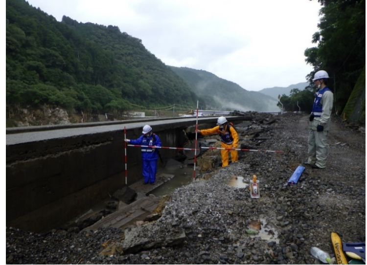
河川護岸被災箇所の現地調査（熊本県球磨郡球磨村）