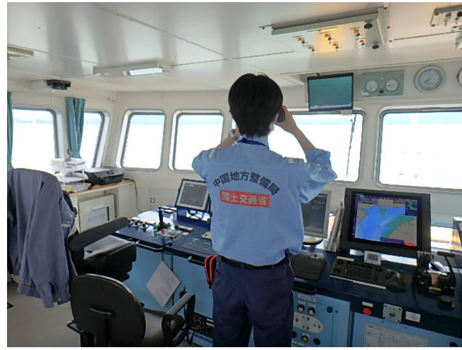
漂流物の調査状況(船上から)