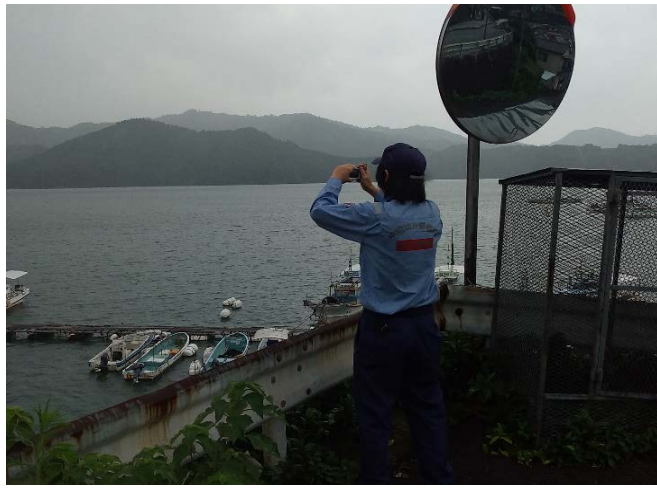
漂流物の調査状況(陸域から)